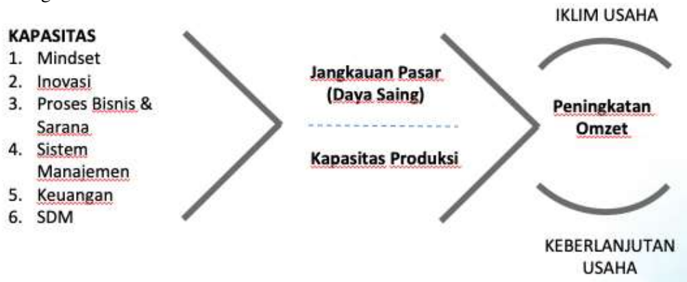
Gambar 3. Fokus UMKM Naik Kelas

Setelah dipetakan, upaya untuk UMKM Naik Kelas sebaiknya berfokus pada “Peningkatan Omzet” sebagaimana gambar berikut ini.