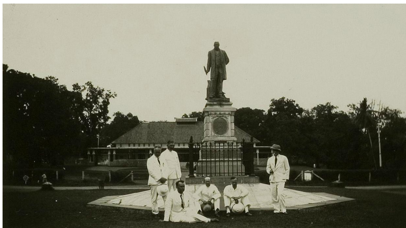
Gambar 6 Gedung Wisma Karya Subang 1920-an dengan patung pendirinya Meneer Hofland. Kondisi saat ini belum banyak mengalami perubahan.