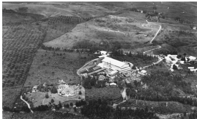
Gambar 3 Perkebunan Teh Pasir Junghun, Malabar 1928 kondisi saat ini masih seperti saat foto diambil tahun 1928.