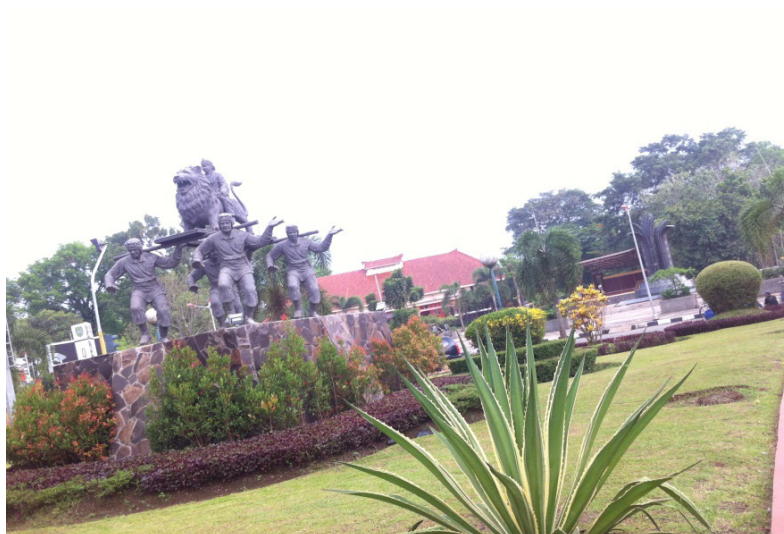
Gambar 7 Gedung Wisma Karya masa kini. Patung Kolonial digantikan patung kesenian Sisingaan lambang perlawanan rakyat Subang terhadap penjajah