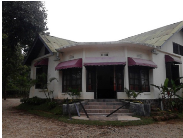
Gambar 5 Rumah yang sama tengah direnovasi