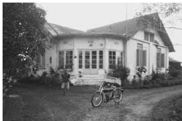
Gambar 4 Rumah Staf Inggris di Subang 1920-an