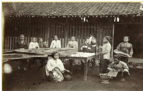
Gambar 1 Foto penguasa perkebunan teh dengan para buruh teh tahun 1920-an

Identitas dipercaya dibentuk dari nilai-nilai histori, geografi, biologi, serta institusi yang memproduksi dan mereproduksi dari kumpulan memori, fantasi personal, apparatus kekuasaan, dan wahyu agama. Oleh karena itu, konstruksi sosial identitas selalu ditandai dengan adanya hubungan kuasa. Kuasa menunjukkan adanya ideologi yang dominan. Dominasi nilai-nilai kolonial tersebut dirasakan sebagai bentuk penaklukan. Penaklukan yang dilakukan bisa terasa atau tidak, seperti melihat diri kita di depan cermin. Jika cermin tersebut menggunakan bingkai kolonial, individu yang tengah berkaca akan melakukan imitasi ataupun perlawanan terhadap gambaran yang mereka lihat.