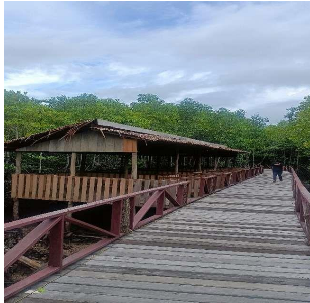
Gambar 4 : Pondok Kecil Wisata Mangrove Desa Batu Ampar

panjang dari kayu sebagai tempat kumpul yang digunakan wisatawan untuk beristirahat.