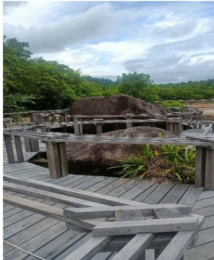
Gambar 1 : Batu Kembar Wisata Mangrove Desa Batu Ampar

Kemudian, Berjarak sekitar 20 meter dari pintu masuk terdapat dua batu besar yang memutar jembatan, masyarakat setempat menyebutnya batu kembar. Batu kembar tersebut merupakan batu yang secara alami sudah berada di kawasan wisata mangrove. Kalau batu tersebut tidak dapat digeser atau dipindahkan karena pada saat pembangunan sudah dicoba untuk memindahkan batu tersebut namun tidak bisa. Juga di salah satu dasar batu tersebut terdapat lubang seperti goa kecil yang diyakini bisa sampai ke pantai. Dari cerita masyarakat kalau dua batu tersebut adalah awak kapal dari kapal Thailand yang sudah menjadi batu. Batu kembar tersebut saat ini termasuk menjadi salah satu spot foto di wisata mangrove.