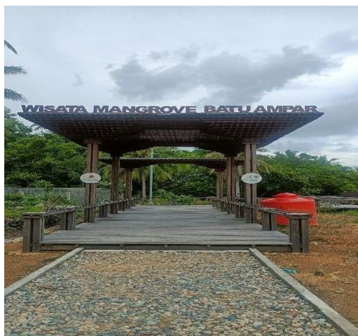
Gambar 2 : Gerbang Pintu Masuk Wisata Mangrove Desa Batu Ampar

ampar yang ukiran kayunya bercirikan khas Melayu. Gerbang pintu masuk tersebut merupakan salah satu bantuan dana CSR dari perusahaan Medco Energi yang berada di Pulau Palmatak, Kabupaten Anambas.