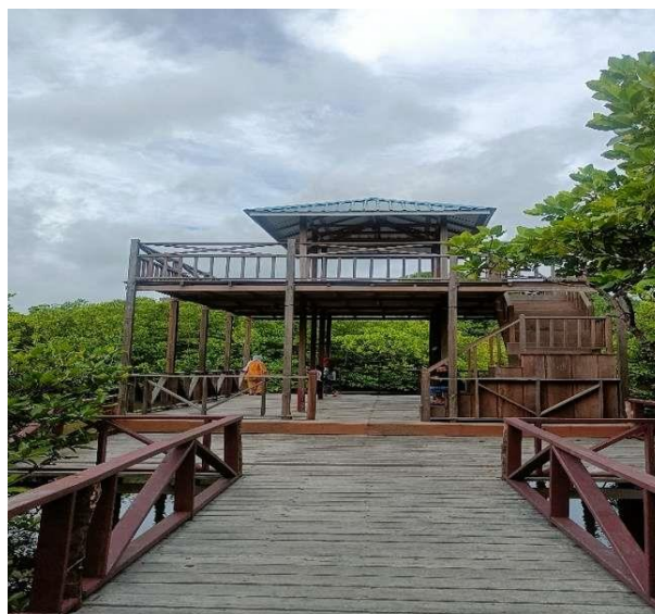
Gambar 5 : Gazebo Wisata Mangrove Desa Batu Ampar

Di penghujung jembatan dibangun gazebo sebuah gazebo besar berlantai dua sebagai salah satu fasilitas dengan ruang terbuka sebagai alternatif tempat berkumpul dan melakukan kegiatan santai bersama anggota keluarga lainnya. Selain gazebo yang menarik, pemandangan dari lantai 2 gazebo sangat indah sehingga dapat menjadi salah satu spot foto terbaik di wisata mangrove Desa Batu Ampar. Saat ini gazebo tersebut biasanya digunakan wisatawan sebagai tempat berkumpul suatu acara organisasi atau forum tertentu. Seperti tempat rapat atau pertemuan lainnya.