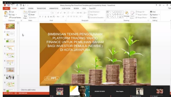
Gambar 2. Pembukaan PKM

Pada proses pengabdian terjadi dialog dua arah antara yang cukup aktif dimana salah satu peserta bimbingan teknis merupakan investor muda ( newbie ) tetapi belum pernah mendengar dan menggunakan platform yahoo finance . Dalam pemilihan saham yang dilakukan oleh newbie yaitu dengan mendengar saran yang diberikan oleh broker dari perusahaan sekuritas sehingga saham yang dimiliki merupakan saham yang bagus tetapi cukup mahal untuk mahasiswa dan pada awal mengenal saham, dalam pemilihannya hanya mengikuti para influencer tanpa melakukan analisis pribadi terlebih dahulu.