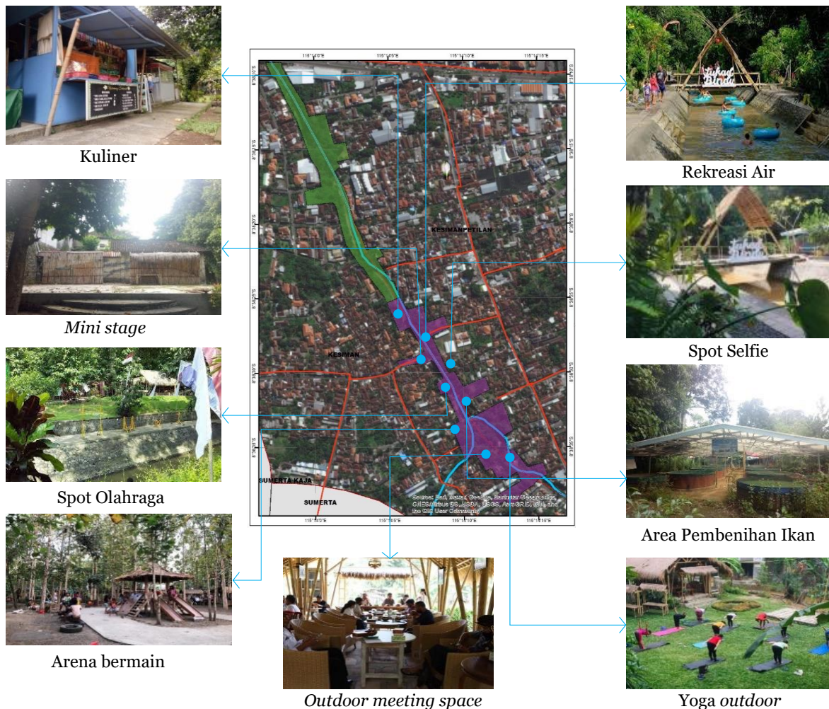
Gambar 3. Penataan Kawasan Rekreatif di Tukad Bindu , Desa Kesiman, Denpasar

Di sepanjang Tukad Bindu juga disediakan fasilitas rekreasi air seperti permainan air yang memanfaatkan aliran air sungai seperti wahana bermain ban terapung, dan wahana bermain seluncuran air. Disana terdapat juga panggung pertunjukan yang kini sedikit mengalami kerusakan, sehingga dapat mengurangi nilai keindahan dari Tukad Bindu sendiri. Karena peran dari mini stage tersebut sangat penting untuk melakukan kegiatan-kegiatan, seperti pertunjukan kesenian yaitu pertunjukan gambelan, tari-tarian, pertunjukan anak-anak TK. Kegiatan yang dilakukan di mini stage ini tidak menentu, karena untuk kegiatan-kegiatan yang dilakukan di panggung terbuka ini tidak memiliki jadwal tertentu. Panggung pertunjukan ini dapat digunakan oleh semua kalangan baik generasi muda, anak-anak, dan lansia. Selain itu juga terdapat lokasi bermain anak-anak seperti perosotan, ayunan, dan jungkat-jungkit. Selain itu, juga terdapat permainan tradisional yang ada di Tukad Bindu seperti enggrang , deduplak , terompah dan olahraga tradisional lainnya. Beberapa permainan tersebut dilihat dari kondisinya kurang baik seperti cat yang sudah mengelupas, berkarat, sehingga perlu adanya perbaikan guna meningkatkan keamanan dan kenyamanan pengunjung.