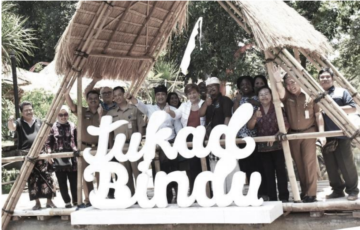
Gambar 5. Tukad Bindu Sebagai Ruang Kreatif Generasi Muda

respon yang baik dari masyarakat sekitar maka generasi muda juga akan patah semangatnya untuk ikut serta dalam penataan Tukad Bindu .