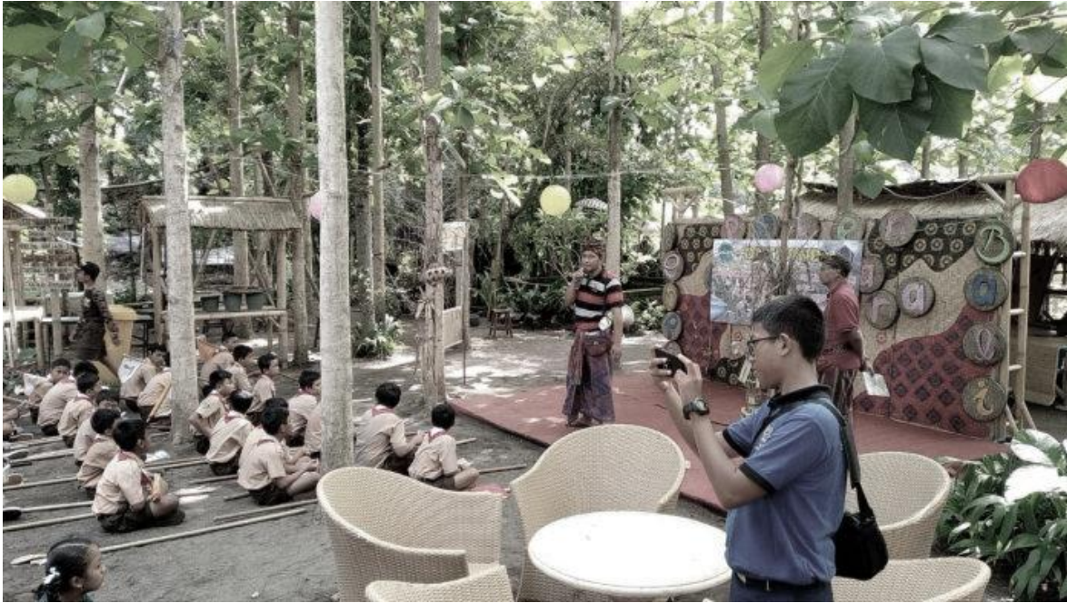
Gambar 4. Pemanfaatan Kawasan Tukad Bindu Sebagai Ruang Diskusi dan Belajar