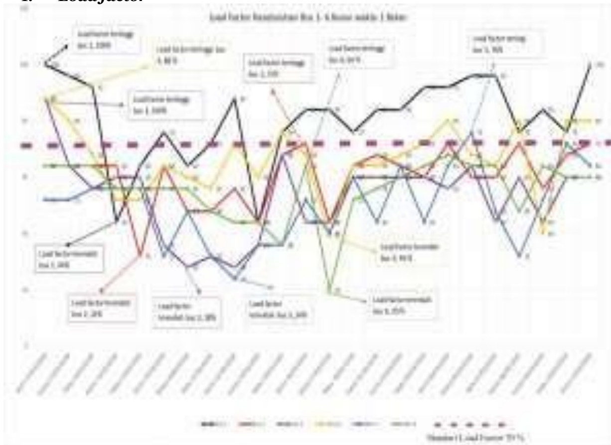
Gambar 1. Grafik Load factor Bs 1-6