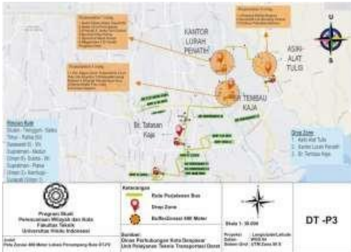
Gambar 2. Peta Buffer 400 BS-6

Pemberhentian disini dapat berupa halte maupun titik kumpul, jadi berdasarkan hasil analisis yang menggunakan buffer 400 meter pada peta mendapatkan hasil bahwa hampir semua tempat titik kumpul yang berjumlah 19 di 12 trayek jarak berjalan anak menuju titik kumpul tidak melebihi 400 meter atau di bawah 400 meter, dengan kata lain jarak berjalan pelajar menuju titik kumpul dikategorikan ideal. Berikut salah satu contoh gambar peta buffer jarak berjalan pelajar menuju titik kumpul, mewakili 12 trayek yang ada dalam bus sekolah Kota Denpasar.