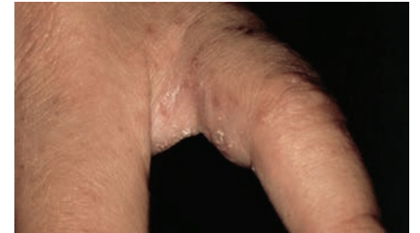
Gambar 2. Skabies: Terowongan (kunikulus) pada sela jari. Papul dan terowongan terdapat pada sela-sela jari tangan. Terowongan berwarna putih, berupa garis lurus, dengan vesikel atau papul di ujung terowongan

Pasien penderita infeksi skabies, juga lebih mudah mengalami infeksi sekunder bakteri. 7