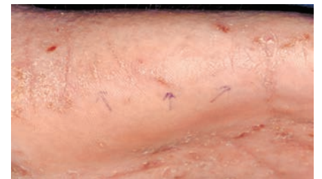
Gambar 3. Skabies: Papul dan kunikulus pada area lateral punggung tangan.