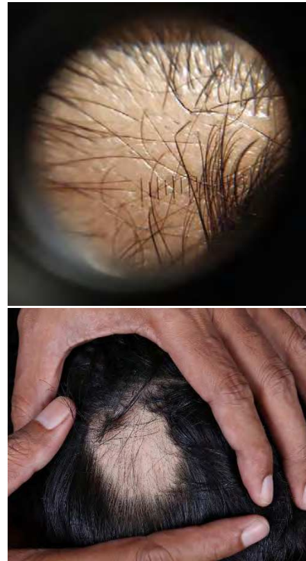
Gambar 5. Kasus 5. Klinis alopesia dan gambaran dermoskopi

berobat. Riwayat atopi, ataupun keluhan serupa pada keluarga disangkal.