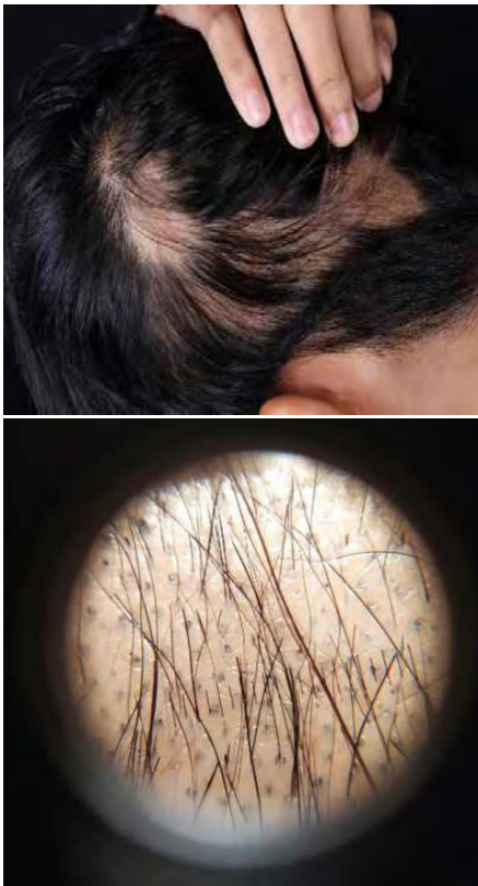
Gambar 4. Kasus 4. Klinis dan gambaran dermoskopi

Pada pemeriksaan fisik, tampak 2 patch alopesia non-sikatrisional berbatas tegas pada area parietal berbentuk oval. Pada lesi alopesia tampak ekskoriasi multipel (Gambar 4). Pemeriksaan hair pull test negatif. Pada kuku jari tangan tampak leukonikia. Tidak didapatkan pembesaran limfonodi.