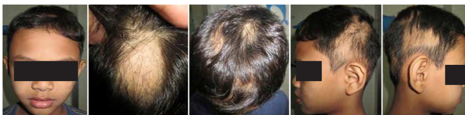
Gambar 3. Kasus 3. Alopesia non-sikatrissial

Pemeriksaan penunjang dermoskopi menunjukkan gambaran black dot , serta rambut " exclamation mark ". Hasil kerokan kulit ataupun rambut dengan larutan KOH tidak menunjukkan adanya elemen jamur. Pemeriksaan lampu Wood tidak menunjukkan fluoresensi. Berdasarkan gambaran klinis dan pemeriksaan penunjang, pasien didiagnosis kerja AA tipe patchy .