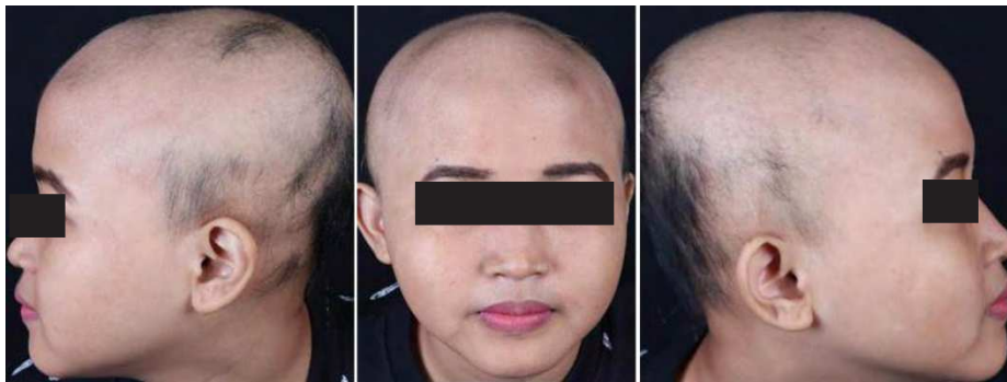
Gambar 1. Kasus 1. Alopesia non-sikatrissial

Seorang anak perempuan berusia 5 tahun dibawa berobat dengan keluhan botak yang makin meluas di kepala. Menurut orang tua, pasien tidak merasa gatal ataupun menggaruk area botak tersebut, juga tidak mencabuti sendiri rambutnya. Riwayat atopi pasien disangkal oleh orang tua. Riwayat keluhan rambut rontok ataupun kebotakan pada keluarga disangkal. Pasien belum pernah berobat.