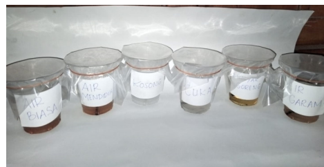
Gambar 4. Percobaan Hari ke-4