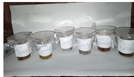
Gambar 5. Percobaan Hari ke-5