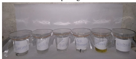
Gambar 1. Percobaan Hari ke-1

Hasil yang diperoleh dari percobaan yang telah dilakukan adalah pada gambar berikut :