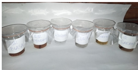
Gambar 3. Percobaan Hari ke-3