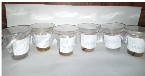
Gambar 2. Percobaan Hari ke-2