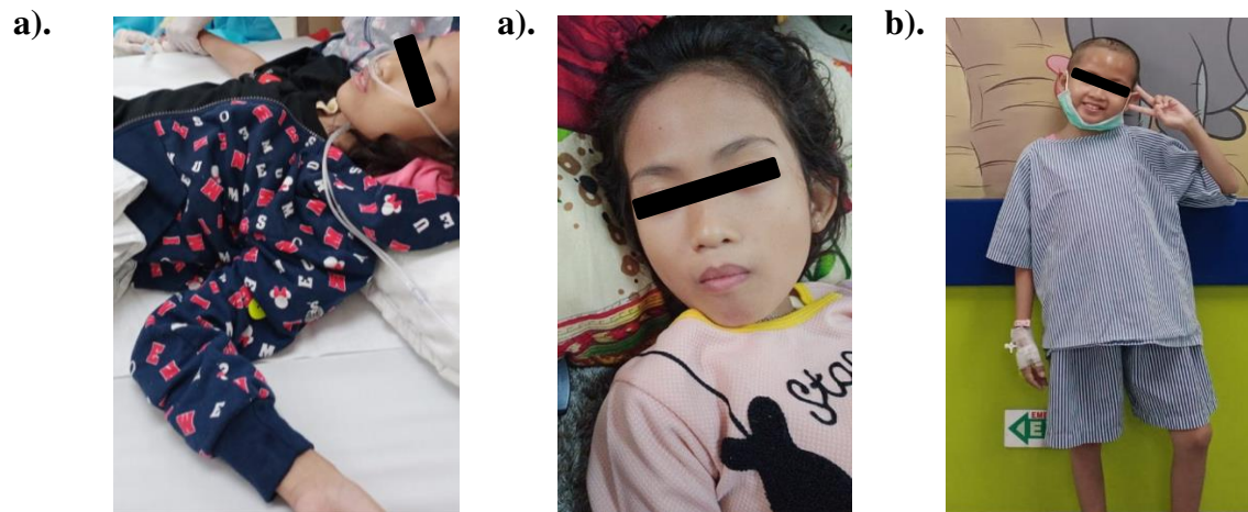
Gambar 1a). Kondisi pasien saat masuk ke rumah sakit, BB 18kg, TB 123cm, IMT 11,9 kg/m 2 . b). Kondisi pasien saat pulang, BB 22,3 kg, TB 123 cm, IMT 14,7 kg/m 2