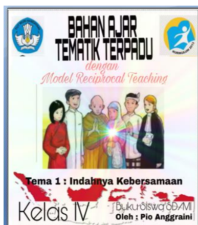
Gambar 2. Sampul bahan ajar