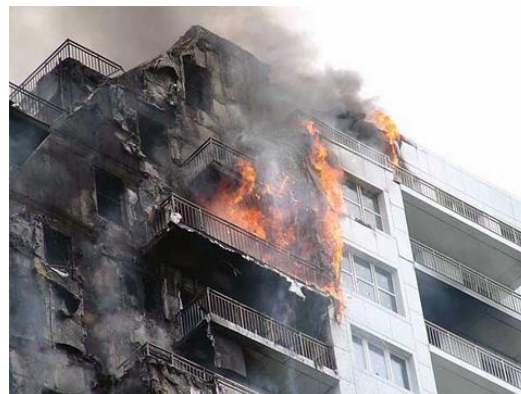
Рисунок 7 – Пожежа у 9-поверховій житловій будівлі, м. Тюмень (РФ)

Пожежа у 9-поверховій житловій будівлі у м. Тюмень, (РФ) виникла 8 січня 2018 р. (рис. 7). Під час капітального ремонту будинку підрядники використовували дешеві легкозаймісті облицювальні панелі групи горючості Г4. Полум'я за лічені хвилини охопило близько 1500 м 2 обшивки будівлі і частину покрівлі. В результаті пожежі будівля майже повністю обгоріла зовні.