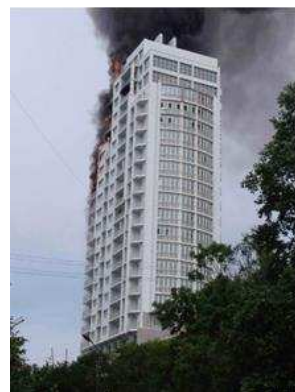
Рисунок 2 – Пожежа у житловому будинку комплексу "Атлантис" (РФ)

Пожежа в житловому будинку по вул. Вадима Гетьмана, 1 б у м. Києві виникла 17 червня 2012 року (рис. 3) внаслідок займання сміття. Вогонь поширився по оздобленню фасаду будинку з 4-го по 25-й поверхи. Пожежа 30 травня 2013 року виникла внаслідок кинутого з верхніх поверхів недопалка, в результаті вогонь поширився по оздобленню фасаду іншої частини будинку з 2-го по 21-й поверхи.