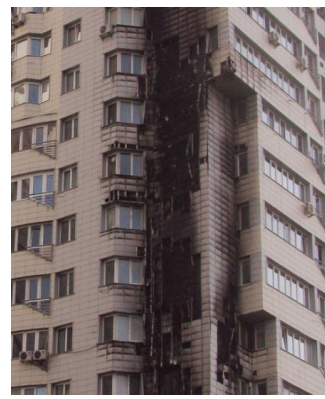
Рисунок 3 – Пожежа у житловому будинку в м. Києві (Україна)

Пожежа в готельному комплексі та бізнес-центрі "Грозний-Сіті" (м. Грозний), що виникла 3 квітня 2013 року (рис. 4). Загальна площа пожежі становила більше 5,0 тис. м 2 . Понад вісім годин пожежні гасили вогонь, що охопив майже 80% фасаду будівлі. Основними причинами її поширення по фасаду стали порушення під час проектування та монтажу навісної фасадної системи. Теплоізоляцію будівлі було виконано з горючого матеріалу «Alucobond», що має групу горючості Г4 (підвищеної горючості).