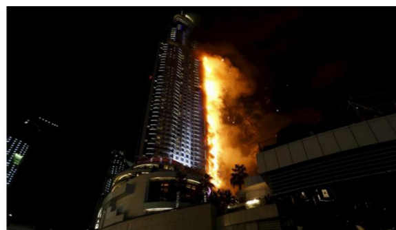
Рисунок 6 – Пожежа готель-хмарочоса «The Address Downtown», м. Дубаї (ОАЕ)

31 грудня 2015 року за кілька годин до святкування нового року в Дубаї сталася НС в хмарочосі «The Address Downtown» (рис. 6), розташованому поруч з найвищою будівлею в світі «Бурдж Халіфа». Вогонь, що виник на 20-му поверсі будівлі, поширився практично по всій висоті 63-поверхового готелю в центрі міста. Через сильний вітер полум'я швидко охопило всю будівлю. Згори на землю почали падати уламки згорілих конструкцій. Сотні людей були терміново евакуйовані, постраждало 15 людей.