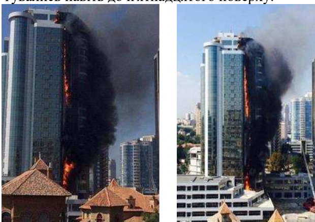
Рисунок 5 – Пожежа у житловому комплексі Gagarin Plaza-1 , м. Одеса (Україна)

НС в житловому комплексі Gagarin Plaza-1 (м. Одеса), що виникла 29 вересня 2015 року на балконі останнього поверху внаслідок необережного поводження з вогнем під час проведення ремонтних робіт (рис. 5). Горіння розпочалося з мансардного поверху, після чого полум'я швидко поширилося до нижніх поверхів та охопило увесь периметр будівлі. Для локалізації пожежі знадобилося більше п'яти годин. У новобудові не було пожежних гідрантів, а пожежні драбини не дотягувались навіть до п'ятнадцятого поверху.