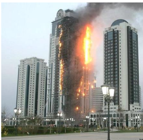
Рисунок 4 – Пожежа у готельному комплексі та бізнес центрі “Грозний-Сіті” (Чеченська республіка, РФ)

НС в житловому комплексі Gagarin Plaza-1 (м. Одеса), що виникла 29 вересня 2015 року на балконі останнього поверху внаслідок необережного поводження з вогнем під час проведення ремонтних робіт (рис. 5). Горіння розпочалося з мансардного поверху, після чого полум'я швидко поширилося до нижніх поверхів та охопило увесь периметр будівлі. Для локалізації пожежі знадобилося більше п'яти годин. У новобудові не було пожежних гідрантів, а пожежні драбини не дотягувались навіть до п'ятнадцятого поверху.