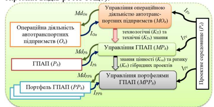
Рисунок 2 - Системні взаємозв'язки між операційним, проектним та портфельним управлінням ГПАП

Під час формування портфельів ГПАП ( PP_h ) використовуються не тільки технологічні ( K_{Tl} ) та технічні ( K_{Tn} ) знання, які отримуються із операційного управління ( MO_a ), але передбачається використання окремих знань щодо особливостей залучення автотранспорту та водіїв для надання окремих видів транспортних послуг (пасажирських чи вантажних перевезень), масштабів (локальних, регіональних, державних та міжнародних), а також прогнозування показників цінності (тривалості та питомих витрат ресурсів на виконання окремих видів робіт тощо).