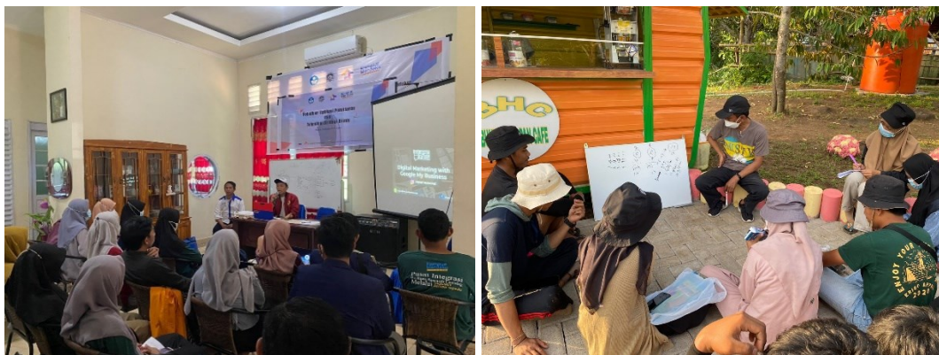
Gambar 1. Learning and Mentoring Process

Sebelum para peserta mengikuti praktik di lapangan dalam pengolahan kelapa terpadu, maka terlebih dahulu akan diberikan pengetahuan awal mengenai jiwa kewirausahaan. Sehingga para peserta mampu melakukan inovasi produk dan mampu memasarkan produk yang telah di olah. Selanjutnya, dari setiap aktivitas yang dilakukan dalam pelatihan ini, maka akan dilakukan proses mentoring. Mentoring ini berfungsi agar para peserta mampu mencatat dan mengaktualisasikan proses kegiatan pengolahan kelapa terpadu dengan baik. Untuk lebih jelasnya, disajikan kegiatan Learning and Mentoring Process pada gambar 1.