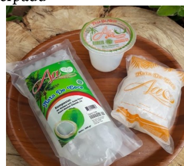
c) Sari Kelapa