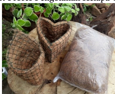
b) Sabut Kelapa