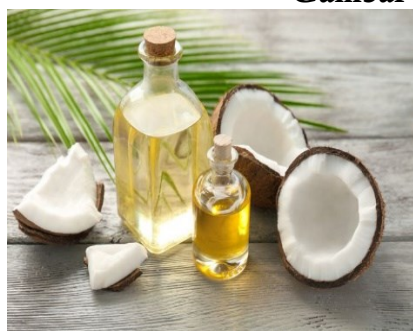
a) Minyak Kelapa