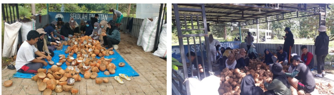
Gambar 2. Proses Pengolahan Kelapa Terpadu

Pengolahan sari kelapa didasarkan pada sistem pengolahan skala pabrik namun dengan konstruksi dan sistem proses yang dimodifikasi lebih ringkas. Pada unit ini terdapat 6 unit operasi, yakni penampung air kelapa, penampung bahan penambah, unit pencampur, wadah fermentasi, dan pemotongan sari kelapa. Untuk lebih jelas, disajikan kegiatan pengolahan dan produk yang dihasilkan dari kelapa terpadu pada gambar 2 dan 3.