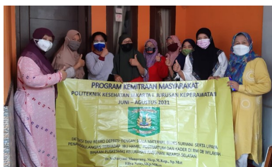
Gambar 2. Bersama kader kesehatan, ibu hamil dan paska melahirkan

Disamping luaran dari target capaian kegiatan program kemitraan kepada masyarakat, hasil kegiatan ini direncanakan akan menerbitkan buku Modul Deteksi Dini dan Pencegahan Depresi dan PostPartum Blues dan dicoba untuk dipublikasikan di jurnal nasional. Besar Kemungkinan untuk mencoba publikasi hasil program kemitraan ini membutuhkan waktu yang lama namun tim perlu membuat sebagai salah satu luaran capaian target.