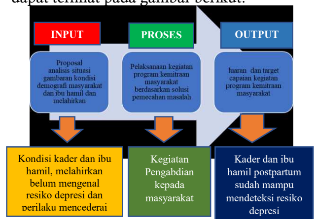
Gambar 1. Metode Pelaksanaan Program Kemitraan Masyarakat

Metode pelaksanaan program kemitraan masyarakat merupakan teknik atau cara menyelesaikan permasalahan untuk mencapai tujuan program. Metode pelaksanaan program kemitraan masyarakat melalui pendekatan tiga tahap yakni input proses output. Metode tersebut dapat terlihat pada gambar berikut: