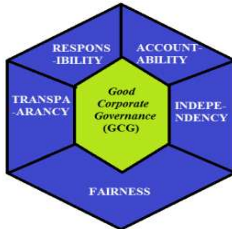
Gambar 1. Prinsip Dasar Good Corporate Governance

Atas pendapat di atas kita dapat menarik satu pengertian dari Good Corporate Governance (GCG) adalah suatu bentuk keputusan dengan memposisikan perusahaan secara jauh lebih tertata dan terstruktur, dengan mekanisme pekerjaan yang bersifat mematuhi aturan-aturan bisnis yang telah digariskan serta siap menerima sanksi jika aturan-aturan tersebut dilanggar.