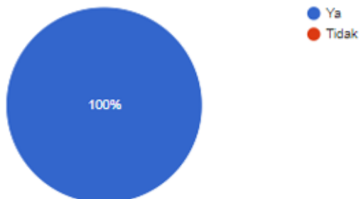
Grafik 3 : Semua peserta tertarik menggunakan OBS dan Zoom setelah pelatihan