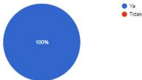
Grafik 2 : Semua peserta menilai pelatihan yang diadakan telah menambah wawasan teknologi