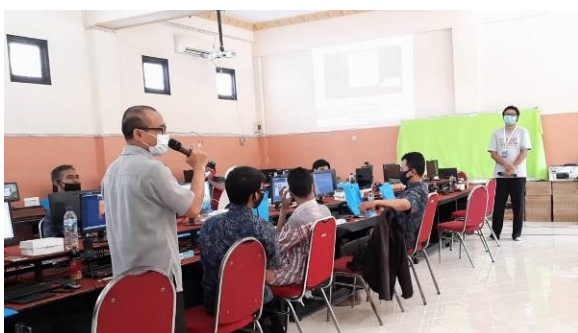
Gambar 6 : Diskusi dan tanya jawab dengan peserta

mengetahui respon peserta terhadap pelatihan yang telah dilakukan. Dari sejumlah guru yang telah memberikan respon, 77.8% mengalami kendala dalam menyampaikan materi pelajaran pada masa pandemi, seperti ditunjukkan pada grafik 1. Hal tersebut tidak lepas dari berkurangnya waktu tatap muka di kelas, sehingga capaian pembelajaran pun tidak optimal. Pada grafik 2 menunjukkan semua peserta merasakan manfaat dari pelatihan yang telah diberikan mengenai penggunaan perangkat dan media dalam mengajar secara daring. Hal tersebut