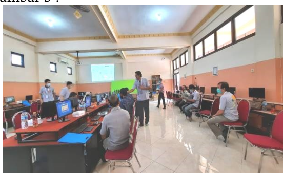
Gambar 3. Suasana di ruang pelatihan

Pada kegiatan pelatihan untuk guru diadakan dalam dua sesi. Pada sesi pertama, guru-guru diberikan penjelasan mengenai strategi mengajar yang interaktif menggunakan aplikasi Zoom dan Quizizz , seperti yang ditunjukkan pada gambar 2, Sedangkan pada sesi kedua, para guru mendapat penjelasan teknis penggunaan perangkat mengajar seperti ditunjukkan pada gambar 3 .