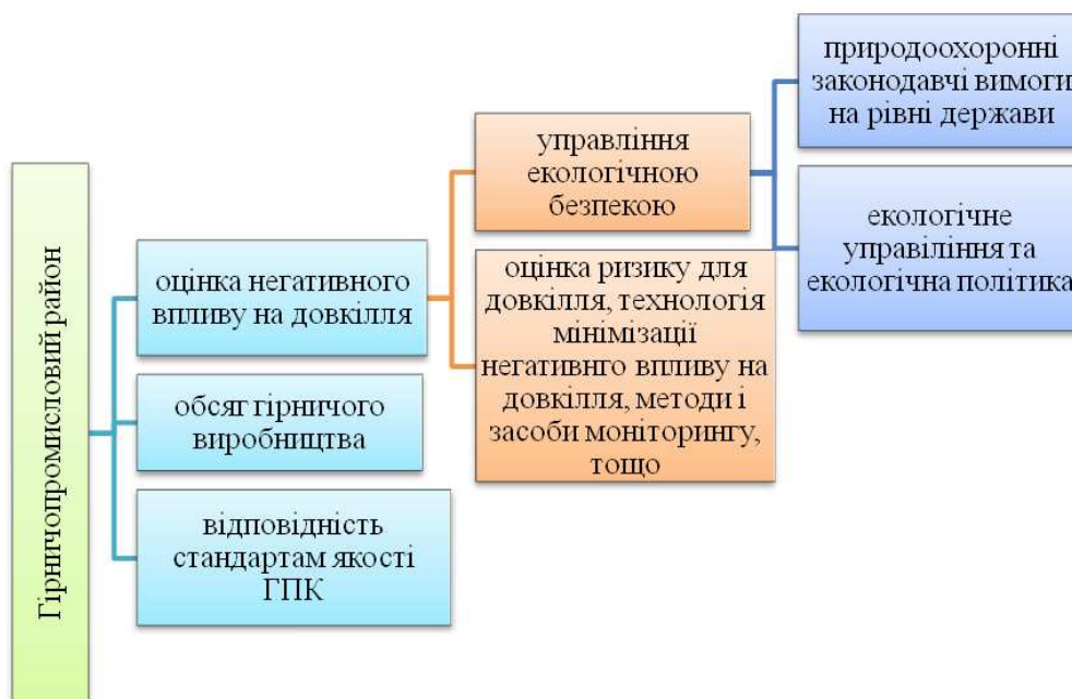
Рисунок 1 – Чинники екологічного управління гірничопромислового району

Проведений аналіз управління екологічною безпекою у гірничопромислових районах виділив такі чинники, які свідчать про низьку екологічну ефективність, а саме: зростання показників забруднення довкілля; збільшення поточних витрат на капітальний ремонт основних фондів природоохоронного призначення; зниження інвестиційної активності в галузі охорони довкілля; збільшення платежів за наднормативний вплив на довкілля. Ці проблеми природоохоронної діяльності не сприяють досягненню основної цілі – управління екологічною безпекою. У зв'язку з цим потрібне подальше вдосконалення екологічного управління. При організації екологічної служби у гірничопромислових комплексах повинен бути застосований комплексний підхід у здійсненні ефективного управління екологічною безпекою та оцінка впливу на довкілля, в тому числі при розробці екологічної політики, визначенні основних завдань, організації діяльності, мотивації та контролю.