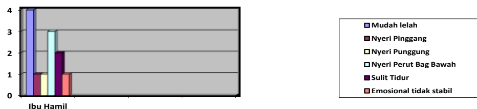
Gambar 1.1 Grafik Ketidaknyamana Ibu Hamil di RW 07 Margasari Karawaci Tangerang

Hasil yang diharapkan dalam kegiatan senam prenatal yoga ini adalah menurunnya ketidaknyamanan ibu hamil di RW 07 Margasari Karawaci Tangerang. Berikut gambaran ketidaknyamanan yang dialami oleh ibu hamil sebelum kegiatan senam prenatal yoga :