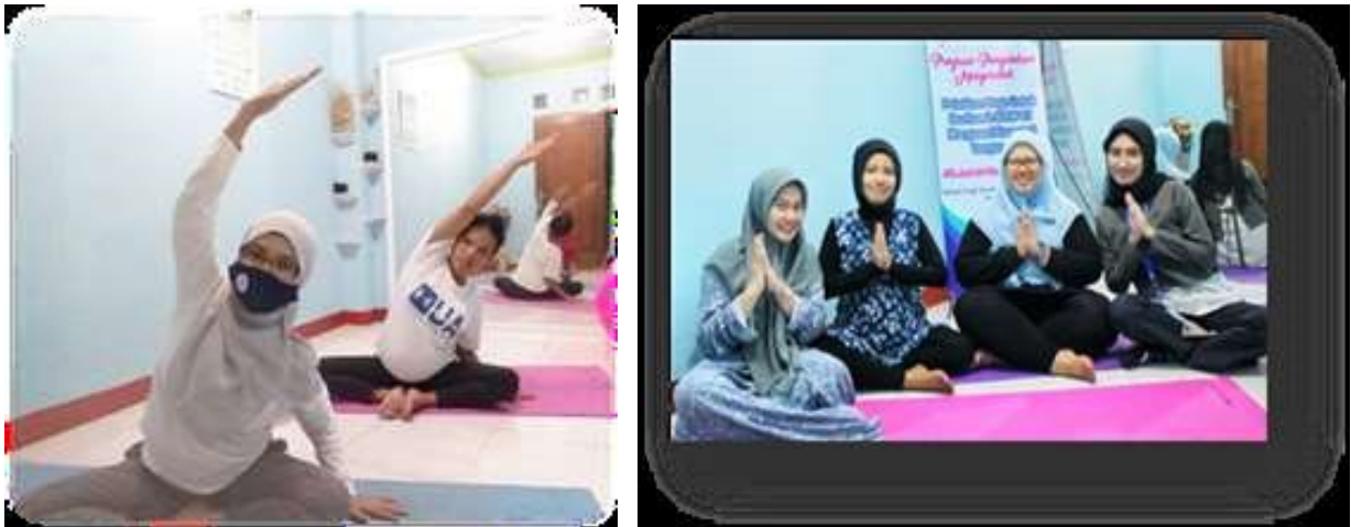
Gambar 1. Proses Kegiatan Senam Prenatal Yoga

Kemudian diadakan kegiatan senam prenatal yoga selama enam minggu, dengan frekuensi 2-3 kali pertemuan bagi ibu hamil.