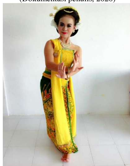
Gambar 11. Gerak Sigeg Silang