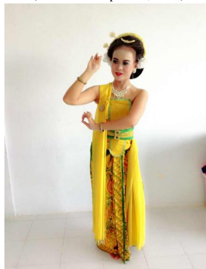
Gambar 4. Gerak Jamas