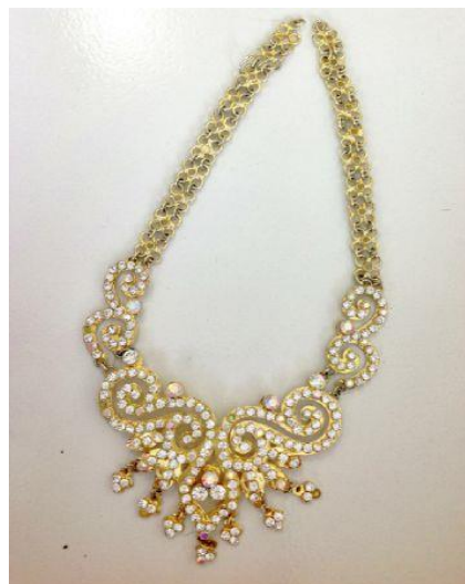
Gambar 20. Kalung (Dokumentasi penulis, 2020)