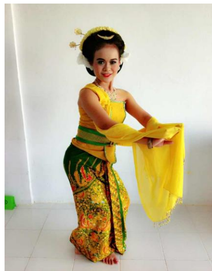
Gambar 9. Gerak Sigeg Sampur Kiwo