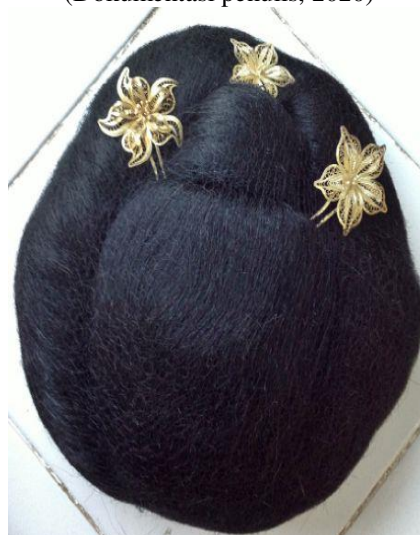
Gambar 22. Sanggul atau Konde