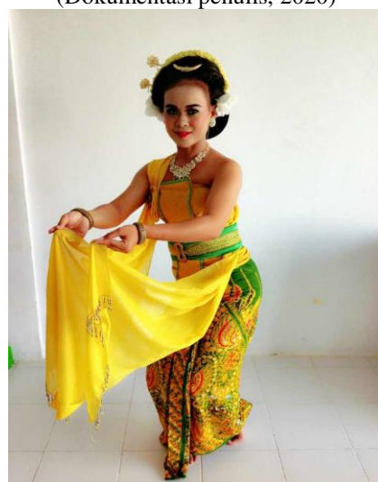
Gambar 10. Gerak Sigeg Sampur Tengen (Dokumentasi penulis, 2020)