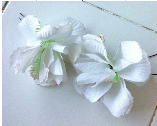
Gambar 28. Kembang