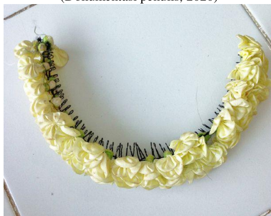
Gambar 21. Bando Melati