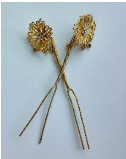
Gambar 23. Tusuk Konde (Dokumentasi penulis, 2020)