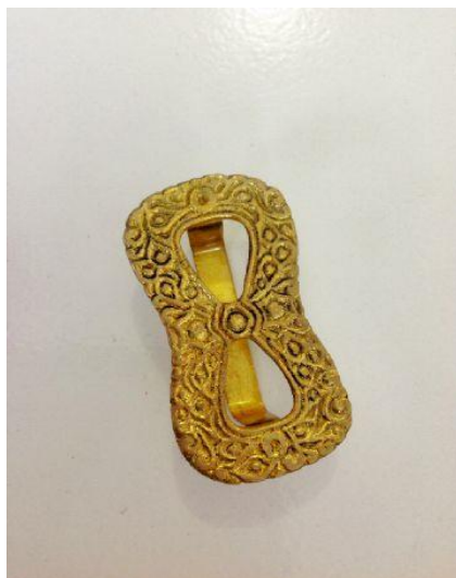
Gambar 29. Timang (Dokumentasi penulis, 2020)