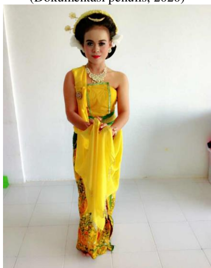
Gambar 8. Gerak Sigeg Ningkup