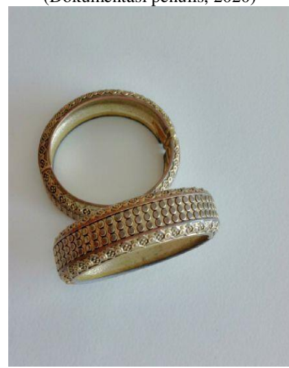
Gambar 27. Gelang