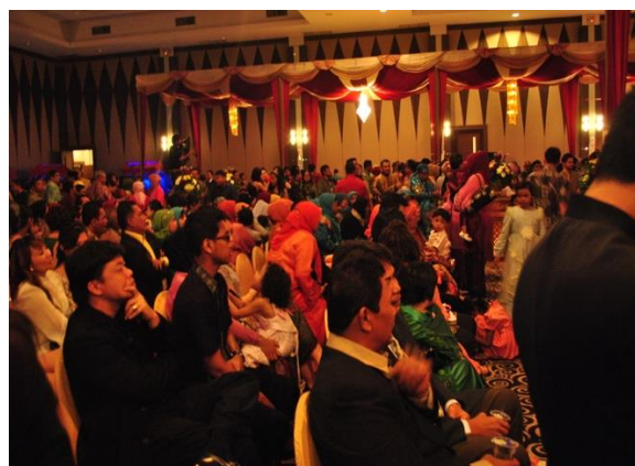
Gambar 19. Penonton tari gambyong di salah satu Hotel di Batam

dinilai berhasil menghibur penonton. Penonton tari gambyong berasal dari beberapa kalangan, baik itu dari kalangan biasa, kalangan menengah dan kalangan atas ataupun pejabat-pejabat penting.