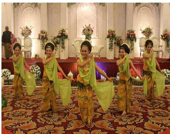
Gambar 31. Pementasan tari gambyong di salah satu Hotel di Batam (Dokumentasi penulis, 2020)

Pementasan tari gambyong tidak harus ditampilkan diatas pentas, tari gambyong juga bisa ditampilkan di arena. Yang bisa dilihat oleh penonton secara keseluruhan. Biasanya pada acara pernikahan tidak ditampilkan diatas pentas, namun jika dalam penyambutan tamu agung, biasanya tari gambyong ditampilkan diatas pentas.