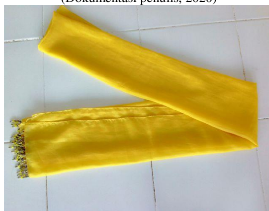
Gambar 16. Sampur (Dokumentasi penulis, 2020)