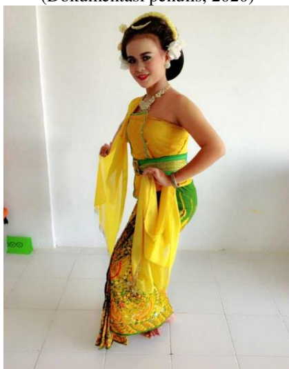
Gambar 13. Gerak Ungkel Kiwo