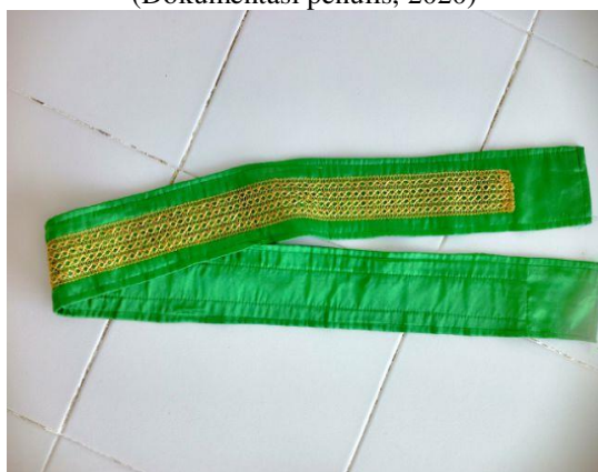
Gambar 19. Epek