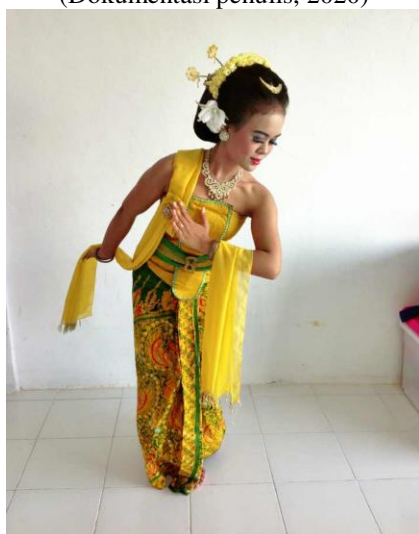
Gambar 14. Gerak Ungkel Seblak

Pada hakikatnya tari dan musik tidak dapat dipisahkan, demikian pula halnya Tari Gambyong di Kota Batam. Tari Gambyong diiringi alunan irama musik yang dimainkan menggunakan musik tradisional Jawa yaitu kendang, gender, penerus gender, bonang, kempul, kenong , dan gong . Akan tetapi, dikarenakan terbatasnya pemain musik yang bisa memainkan alat-alat musik tersebut, maka dalam menampilkan Tari Gambyong Sanggar Duta Santarina menggunakan musik yang berasal dari CD ataupun flasdisk .