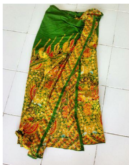
Gambar 15. Jarit Proda

yang digunakan ditelinga penari, 12) bros yang digunakan merupakan pelengkap pendukung yang digunakan pada bagian samping atas kemben dan selendang, 13) gelang digunakan sebagai aksesoris pelengkap yang digunakan untuk mempercantik penampilan penari yang dipasang ditangan kanan dan tangan kiri, 14) kembang aksesoris kepala yang dipasang dibagian belakang telinga, diantara rambut dan sanggul, 15) timang adalah aksesoris yang diselipkan ditengah epek . Berikut kostum Tari Gambyong di Sanggar Duta Santarina Batam: