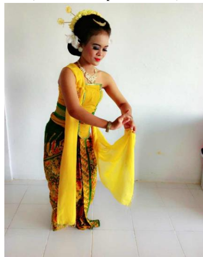
Gambar 5. Gerak Nitik Batik (Dokumentasi penulis, 2020)