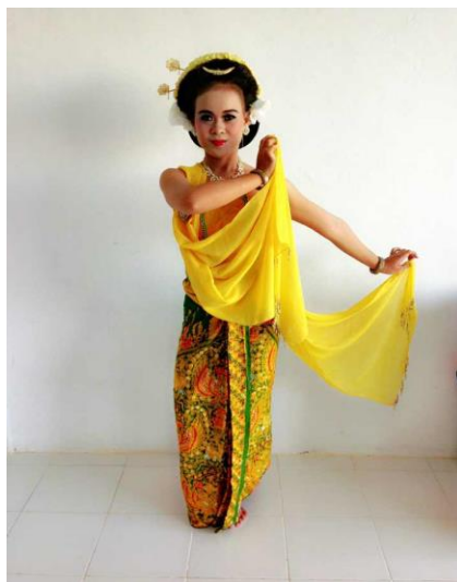
Gambar 12. Gerak Trisek (Dokumentasi penulis, 2020)