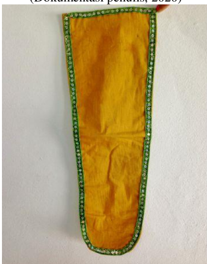
Gambar 18. Ilat-ilatan