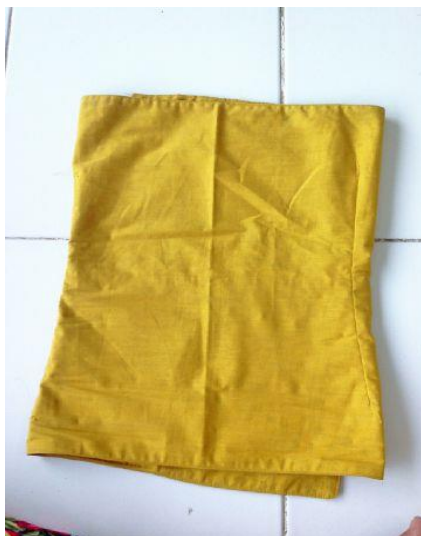
Gambar 17. Kemben