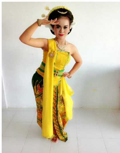
Gambar 1. Gerak Ulap-Ulap (Dokumentasi penulis, 2020)

batik, nitik tengen, seblak tengen, sigeg ningkup, sigeg sampur kiwo, sigeg sampur tengen, sigeg silang, trisek, ungel kiwo, ungel seblak. Berikut gambar gerakan pada Tari Gambyong di Sanggar Duta Santarina: