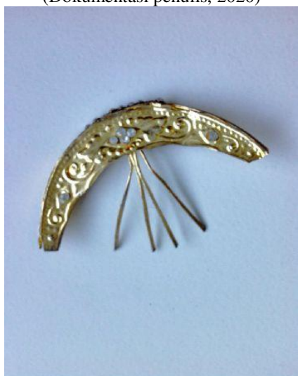
Gambar 24. Sunggar