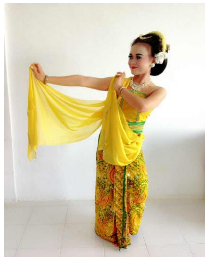
Gambar 3. Gerak Heyeg Tengen