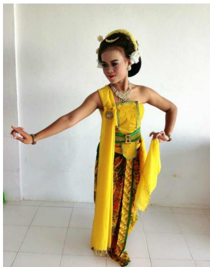
Gambar 6. Gerak Nitik Tengen