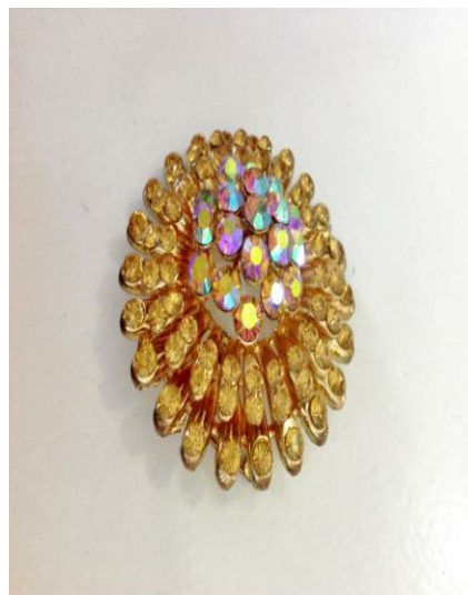
Gambar 26. Bros