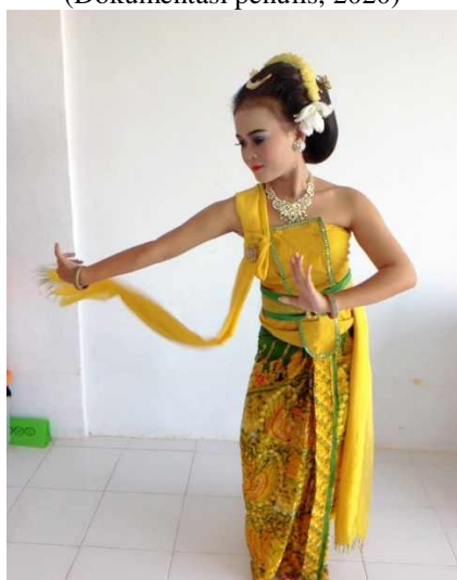
Gambar 7. Gerak Seblak Tengen