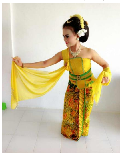
Gambar 2. Gerak Seblak Jiro Kiwo (Dokumentasi penulis, 2020)