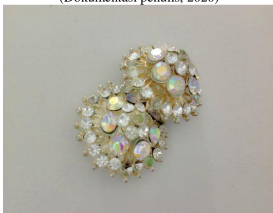
Gambar 25. Giwang