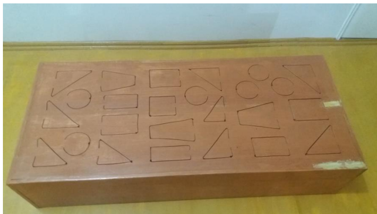
Gambar 1. Getrung Besar