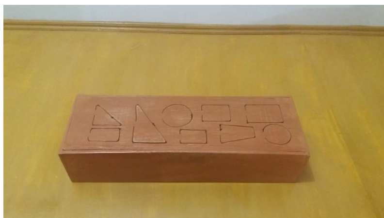
Gambar 5. Getrung Kecil