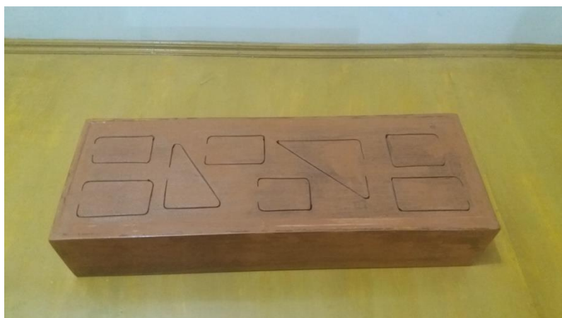
Gambar 2. Getrung sedang