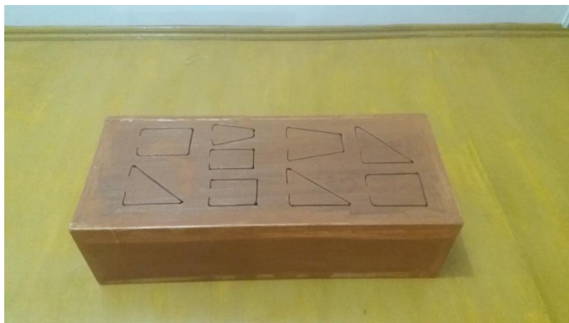
Gambar 4. Getrung Menengah