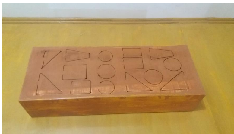
Gambar 3. Getrung Sedang