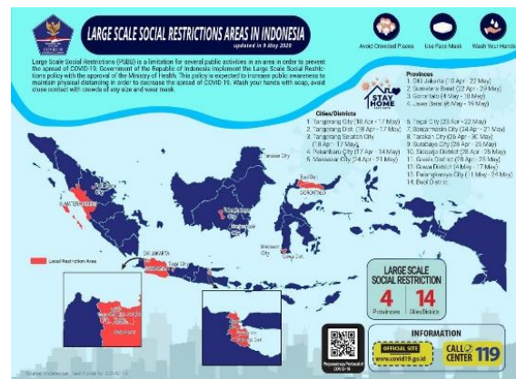
Gambar 4. Daerah yang telah menerapkan PSBB

Adapun beberapa daerah yang telah menerapkan PSBB untuk mencegah penyebaran virus Corona sampai dengan tanggal 8 Mei yaitu sebagai berikut.