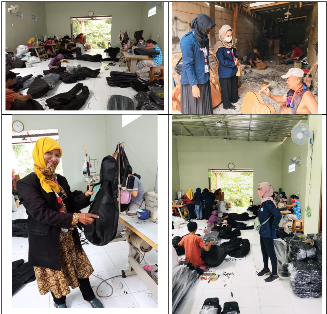
Gambar 3. Pelaksanaan Kegiatan Kunjungan Industri Kerajinan UMKM