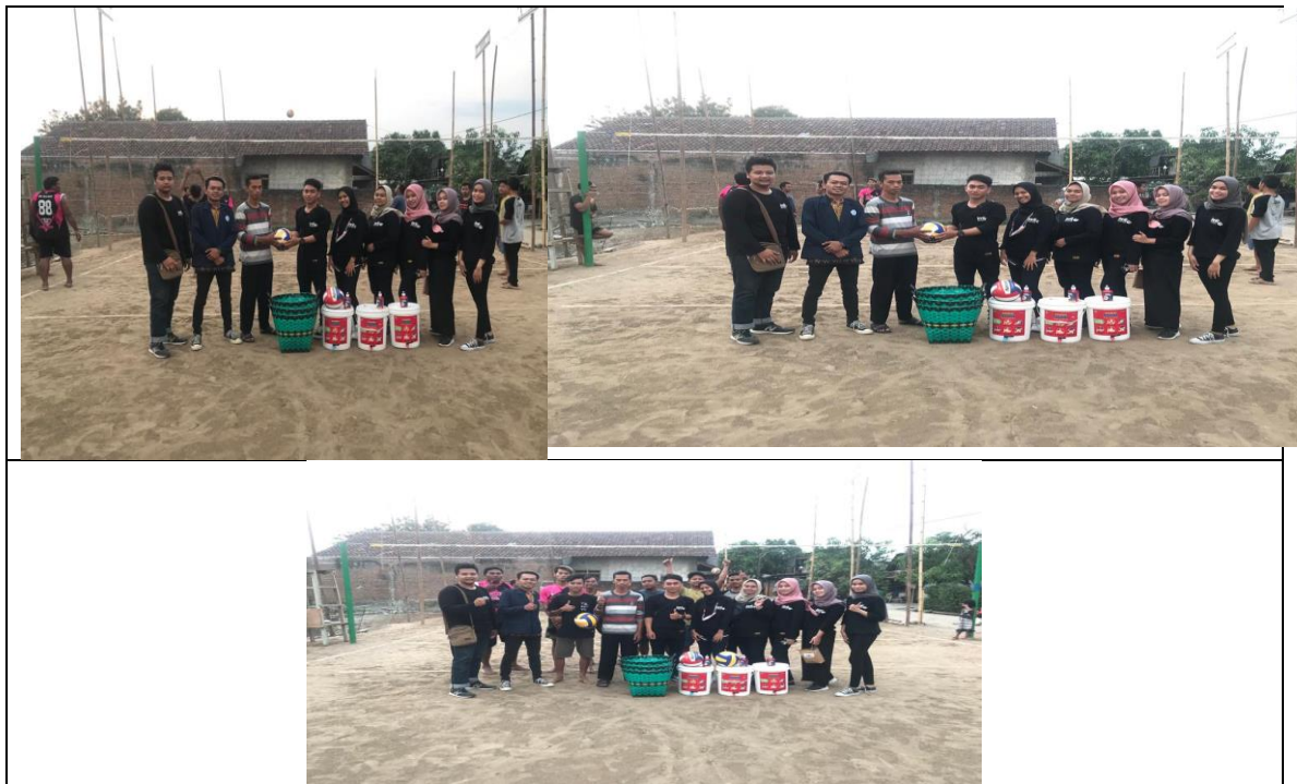
Gambar 9. Pelaksanaan Kegiatan Pertandingan Volly Ball Bersama Karangtaruna Dan Penyerahan kenangan-kenangan