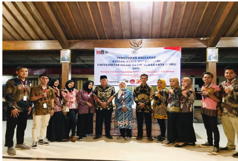
Gambar 10. Pelaksanaan Kegiatan Penutupan