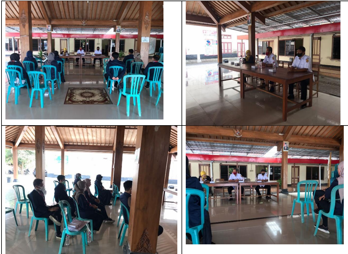
Gambar 2. Persiapan Kegiatan

Kegiatan ini diawali dengan mengurus perijinan kepada Kepala Desa , lalu dilanjutkan dengan penyerahan mahasiswa dari kampus kepada desa, lalu pemberian arahan tentang pelaksanaan kegiatan-kegiatan yang akan dilaksanakan di desa tersebut.