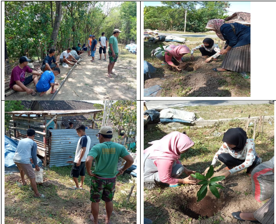
Gambar 6. Pelaksanaan Kegiatan Menanam 1000 pohon