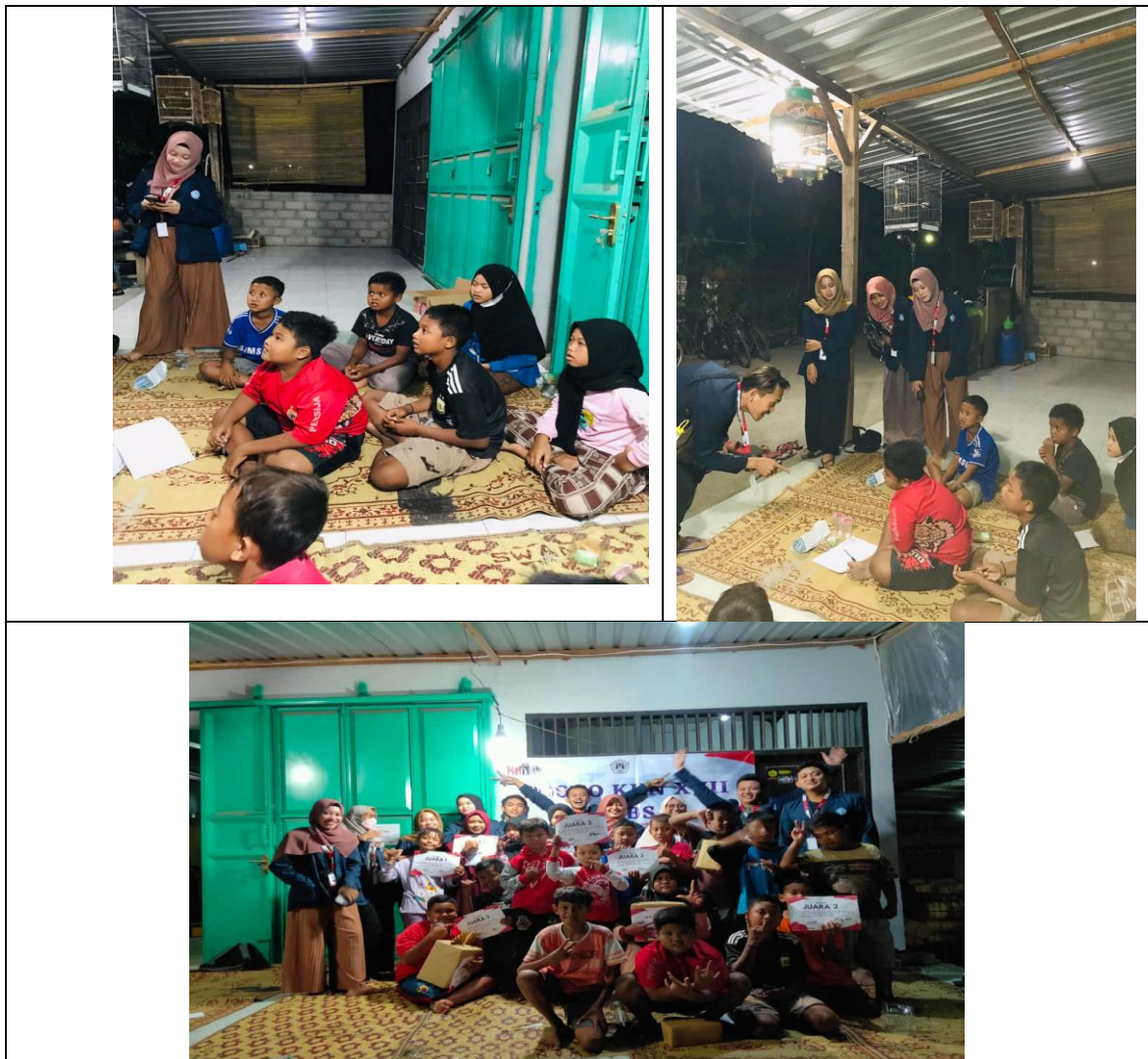
Gambar 5. Pelaksanaan Kegiatan Cerdas Cermat