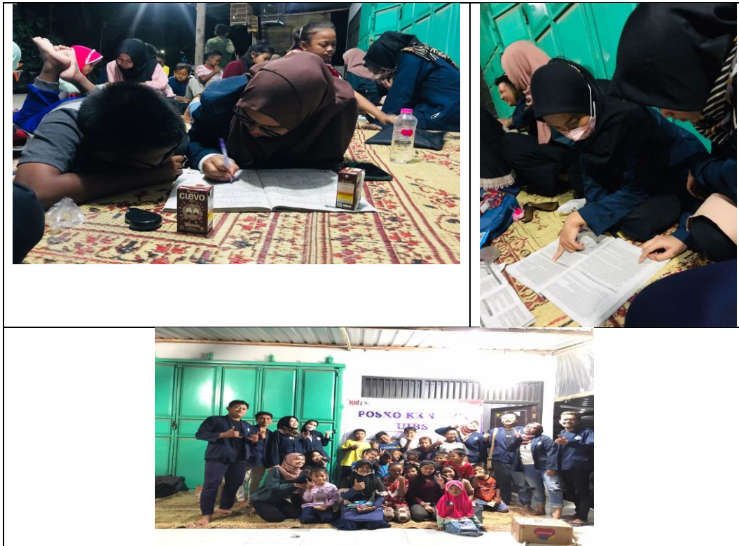
Gambar 4. Pelaksanaan Kegiatan Bimbingan belajar tingkat Sekolah Dasar

nilai di sekolah dan anak-anak mendapatkan metode belajar yang menyenangkan dibandingkan dengan metode konvensional.