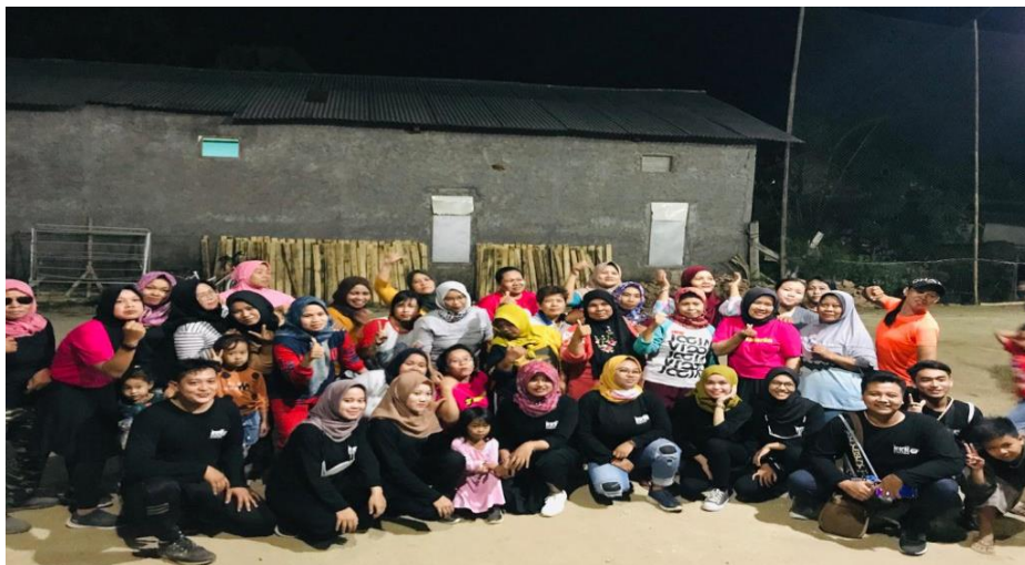
Gambar 8. Pelaksanaan Kegiatan Senam jasmani bersama ibu-ibu Desa Kembangan

Kegiatan senam dilakukan sebagai sarana menjaga kebugaran tubuh dan kesehatan di tengah pandemic Covid-19. Kegiatan senam diikuti oleh ibu-ibu dari Desa Kembangan yang begitu antusias untuk mengikuti kegiatan ini. Selain diikuti oleh-oleh ibu-ibu yang memang tergabung dalam komunitas senam, kegiatan ini juga diikuti oleh ibu-ibu rumah tangga lainnya.