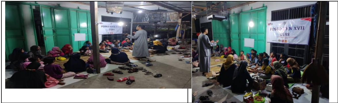
Gambar 7. Pelaksanaan Kegiatan Membaca Al Qur`an dan Pendidikan Agama Islam