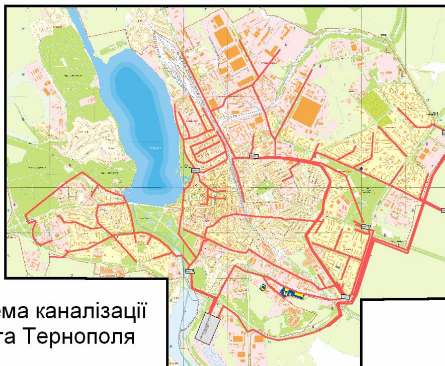
Схема каналізації міста Тернополя

З метою підтримання епідеміологічної безпеки проводять знезараження стічних вод перед їх скидом у водойму. Комплекс обробки осаду, що утворюється в процесі очищення стічних вод, зменшує його обсяг до такого стану, який дає можливість транспортувати його та використовувати в різних областях (наприклад, як добриво).