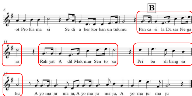
Gambar 5. 3 Motif Pada Frase Tanya Bagian B

Kotak merah merupakan kalimat tanya bagian B, dimulai pada birama kesembilan ketukan ke 4 dan berakhir pada birama kelimabelas ketukan ke 2. Sedangkan kotak biru merupakan frase jawab dari bagian B lagu Garuda Pancasila dan sekaligus menjadi Coda pada lagu Garuda Pancasila, frase jawab dimulai pada birama kelimabelas ketukan 3 atas sampai dengan birama ending ketukan ke 3. Terdapat 3 motif di frase tanya dan frase jawab, perhatikan gambar berikut!