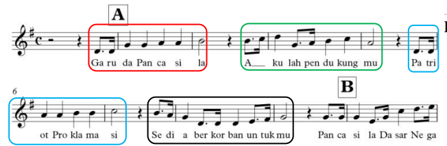
Gambar 3. Motif Utama dan Kembangan Lagu Garuda Pancasila

lagu Garuda Pancasila terdapat 2 motif, yaitu motif utama dan motif kembangan. Perhatikan gambar berikut!