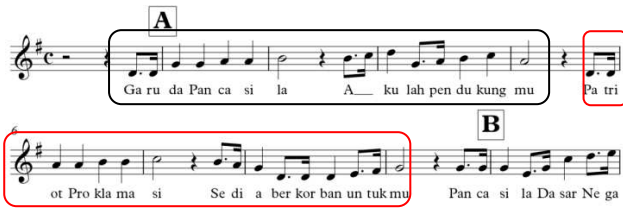
Gambar 2. Frase Tanya dan Jawab bagian A

bagian A terdiri dari 8 bar dan bagian B terdiri dari 10 bar. Pada bagian A, notasi lagu berjalan wajar dan simetris dengan yang seharusnya. Frase tanya ( antecedens ) sebanyak 4 bar, dibalas dengan frase jawab ( consequens ) sebanyak 4 bar, sehingga total dalam bagian 8 bar. Namun pada bagian B terdapat 10 bar, hal tersebut terjadi dikarenakan adanya anak kalimat yang terlalu panjang.