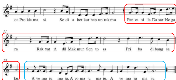
Gambar 4. Frase Tanya dan Jawab Bagian B lagu Garuda Pancasila

penyusunan frasenya. Perhatikan gambar 4 di bawah ini.