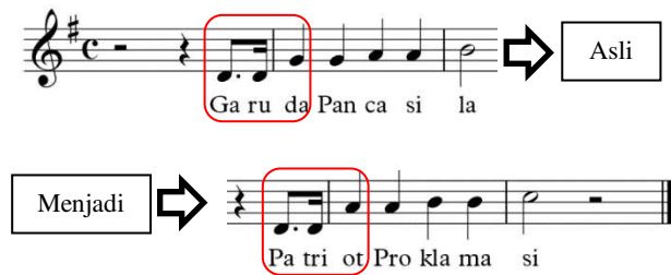
Gambar 9. Pembesaran Interval Lagu Garuda Pancasila

pembesaran interval juga terdapat pada pengolahan motif pada lagu Garuda Pancasila. Pembesaran interval tersebut terjadi pada birama pertama ketukan ke 4 dan birama kelima ketukan ke 4. Perhatikan gambar berikut.