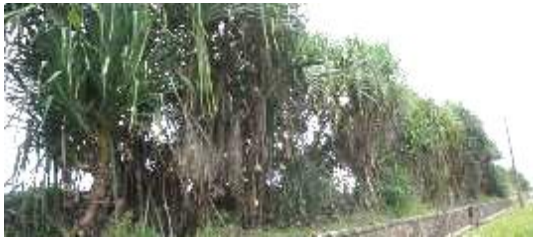
Gbr 01. Pandanus Tectorius Soland

daun. Daun tunggal, panjang 274-284 cm, lebar 7,5- 8 cm, bentuk memita, ujung runcing, seluruh tepi daun berdurri berwarna putih, mengkilat pada ke dua permukaan, permukaan atas berwarna hijau dengan garis-garis memanjang berwarna putih sampai kuning muda (Rahayu & Handayani, 2013). Varietas Pandanus Tectorius yang digunakan untuk material pembuatan kursi adalah varietas soland (gbr.01).