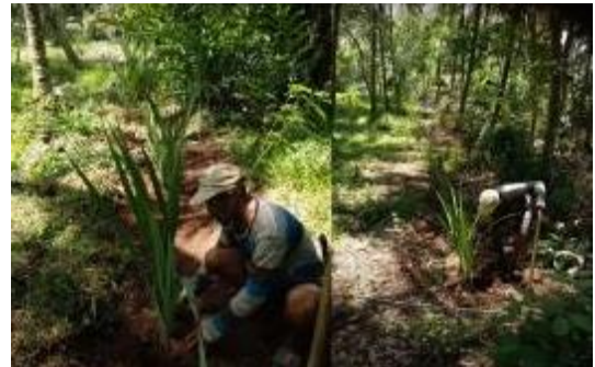
Gbr 02. Proses penanaman tanaman pandan dengan metode tumpang sari

ditemukan sebagai tanaman liar atau ditanam secara tumpang sari (Gbr 02). Proses tumbuh tanaman ini berkisar 6- 10 bulan, kemudian daunnya dipotong dan dapat digunakan untuk berbagai kebutuhan. Umur daun pandan yang baik untuk dijadikan serat pandan minimal berusia 6 bulan.