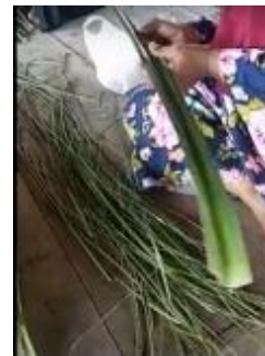
Gbr 05. Proses pembuangan duri daun pandan

Tahap kedua setelah memetik daun pandan adalah membuang durinya dengan cara mengerat dengan menggunakan mata pisau (Gbr 04). Cara pembuangan duri ini dapat dilakukan dengan peralatan sederhana. Sebagian pengrajin ada yang menggunakan mata pisau ada juga yang menggunakan benang layangan untuk membuang durinya.