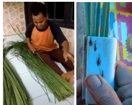
Gbr 06. Proses pembelahan daun pandan

Pada proses ini, daun pandan dibelah sesuai dengan ukuran yang diinginkan. Untuk dijadikan anyaman, biasanya ukuran bilah daun pandan berukuran 0,5 cm (Gbr 06).