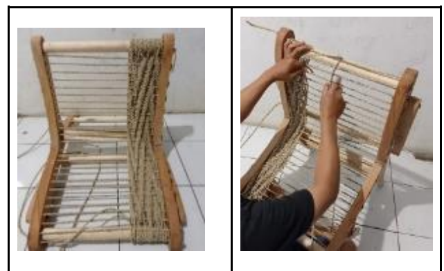
Gbr 11 .Penganyaman Pilin serat pandan pada kontruksi kursi

Setelah melalui pengolahan, material serat pandan yang sudah menjadi pilinan atau tambang dianyam sebagai sandaran dan dudukan kursi. Pilinan serat daun pandan dianyam dengan menggunakan teknik tenun dan tumpal (Gbr 11) dengan hasil uji dari ketahanan menerima beban hingga 75 kg berat badan manusia dalam posisi duduk (Tabel 1). Dari hasil uji coba, material serat pandan memberikan kenyamanan karena sifat elastisnya, sehingga dapat menyesuaikan beban yang ditumpu.