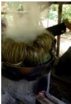
Gbr 08. Tahap perebusan daun pandan

Daun pandan direbus menggunakan air bersih selama kurang lebih 30 menit (Gbr 08). Selama direbus daun pandan ditutup menggunakan plastik.