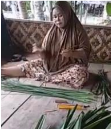
Gbr 07 Proses pembesutan daun pandan

Tahap pembesutan atau penggosokan (Gbr 07) dilakukan agar daun pandan lebih elastis. Bilah daun pandan digosok menggunakan kayu pipih sampai daun menjadi elastis dan siap direbus.