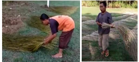
Gbr 09. Tahap Penjemuran daun pandan

Tahap penjemuran daun pandan dilakukan selama 3 hari di bawah sinar matahari. Daun pandan yang telah direbus