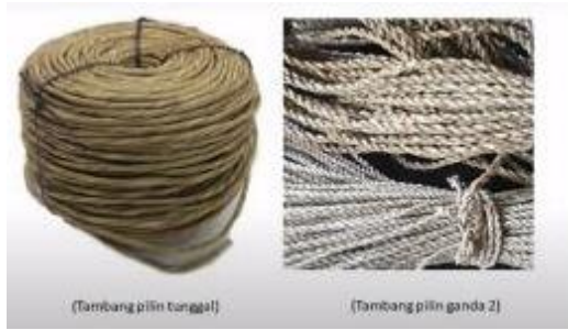
Gbr 03. Tambang pilinan hasil olahan tanaman pandan duri/ pandanus tectorius

masyarakat yang di lingkungannya tersebar tanaman ini.