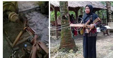
Gbr 10. Tahap Pemilinan Tambang Pandan

Daun pandan yang telah kering dipilin satu dengan cara disambung-sambung secara manual, kemudian dua pilinan itu dijadikan satu melalui teknik memilin manual sederhana.