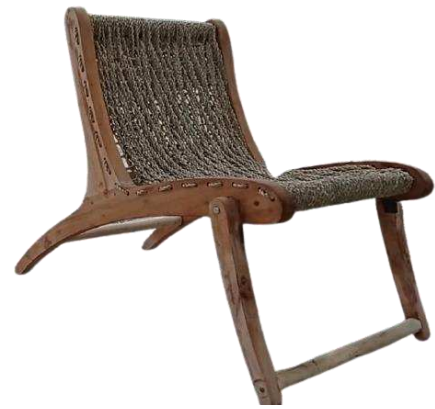
Gbr 10. Kursi Santai Bermaterial Serat Pandan

Material serat pandan yang digunakan untuk mebel biasanya digunakan sebagai bagian utama mebel, tapi bukan digunakan sebagai konstruksi mebel. Begitu pula pada penelitian ini, berdasarkan karakternya, material serat pandan digunakan pada bagian sandaran dan dudukan kursi. Serat pandan yang digunakan adalah serat dengan pilin ganda, sehingga lebih kuat menahan beban manusia dalam posisi duduk. Pada penelitian ini, sample kursi bermaterial serat daun pandan yang digunakan adalah kursi santai karya Husen Hendriyana (Gbr 10). Material serat pandan yang digunakan diambil dari tanaman pandanus tectorius yang tumbuh di daerah Pangandaran, Jawa Barat.