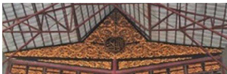
Gambar 3. Ragam Hias Ukiran Kayu Al Quran Al Akbar pada sisi bagian atas yang menyerupai bentuk atap rumah tradisional (Rumah Limas) Palembang. (foto: Heri Iswandi, 2018).

Menariknya, bentuk ukiran tersebut juga ditunjang dengan bentuk-bentuk ukiran ragam hias yang menghiasi setiap lembaran Al-Quran.