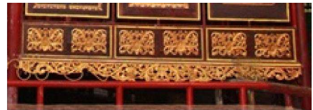
Gambar 4. Ragam Hias Ukiran Kayu Al Quran Al Akbar pada sisi bagian bawah dengan jenis motif tumbuh- tumbuhan (tumbuhan pakis).