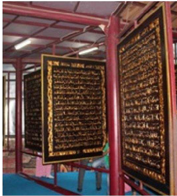
Gambar 2. Ukiran Kayu Al Quran Al Akbar dari dua sisi (depan dan belakang)..

Unsur-unsur lainnya yang membentuk nilai estetik adalah teknik ukiran dengan ciri khas ukiran Palembang. Jika diamati secara teknik, teknik ukiran yang digunakan adalah ukiran sedang ( mezzo relief ), yaitu kedalaman ukiran kaligrafi yang dipahat kira-kira mencapai 1 cm.