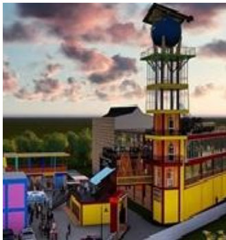
Gambar 8. Desain Pembangunan museum ukiran Al Quran Al Akbar.

Di samping nilai-nilai yang bersifat hakiki, penyajian ukiran kayu khas Palembang pada Al Quran Al Akbar, di dalamnya juga terkandung nilai-nilai sosial dan ekonomi. Semakin banyak masyarakat yang berkunjung, tentunya semakin meningkatkan nilai perekonomian masyarakat di sekitarnya seperti salah satunya adalah pedagang.