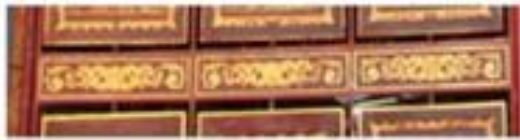
Gambar 5 Ornamen sebagai penghias

maupun di Timur untuk menghias bentuk-bentuk dasar dari kerajinan tangan (perabot, pakian dan sebagainya) juga arsitektur. Bagaimanapun gaya dan corak ornamen harus disesuaikan kepada bidang yang dihias itu, ornamen pada hakikatnya adalah gambaran dari irama dalam garis dan bidang. Sedangkan menurut Mubarat ornamen memiliki fungsi sebagai berikut: Penerapan ornamen dirancang untuk mendukung tampilan objek agar terlihat lebih menarik. Hal ini sesuai dengan konsep dasar ornamen yang bertujuan sebagai penggugah rasa keindahan. (Mubarat & Iswandi, 2018).