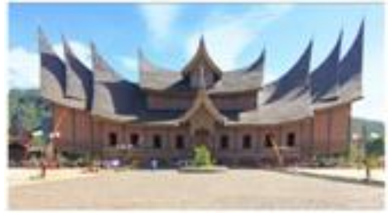
Gambar 4 Ornamen diaplikasikan pada bangunan benda sejarah Memiliki fungsi hias dan filosofi

Walaupun wujud akhir dari suatu desain tetap harus indah, berguna dan dapat diterima oleh masyarakat. Desain merupakan seni terapan setelah diwujudkan menjadi benda, selain desain cabang seni rupa terapan yang lain adalah seni kriya. Salah satu contoh dari seni terapan yang paling dominan adalah seni kriya yang kiranya juga merupakan salah satu contoh dari seni yang paling tua seperti banyak artefak yang terdapat pada candi-candi dan benda bersejarah lainnya. Pada awalnya semua seni menyangkut tugas untuk memenuhi kebutuhan manusia dalam kehidupan sehari-harinya dan itulah apa yang menjadi tugas seni kriya`.