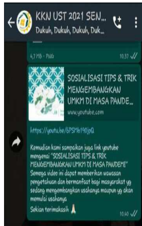
Gambar 3. Whatsapp Group Mitra