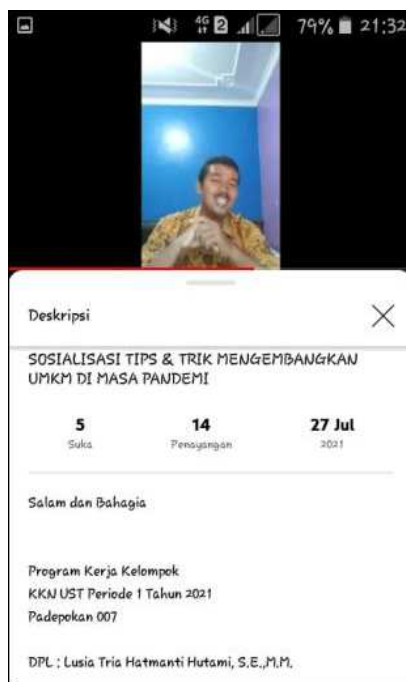
Gambar 3. Video Sosialisasi Tips & Trik Mengembangkan UMKM di Masa Pandemi