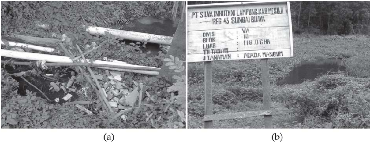
Gambar 1. (a) Pipa pembuangan sampah di samping pabrik (b) Cabang aliran sungai di Register 45 yang terkena limbah pabrik