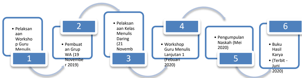
Gambar 1. Alur Penelitian Kelas Menulis Daring