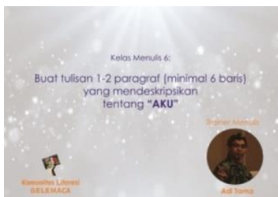
Gambar 2. Materi menulis awal kelas daring dibuka

apa yang harus dikerjakan hari ini? Berikut adalah contoh materi yang diberikan pada kelas menulis daring.