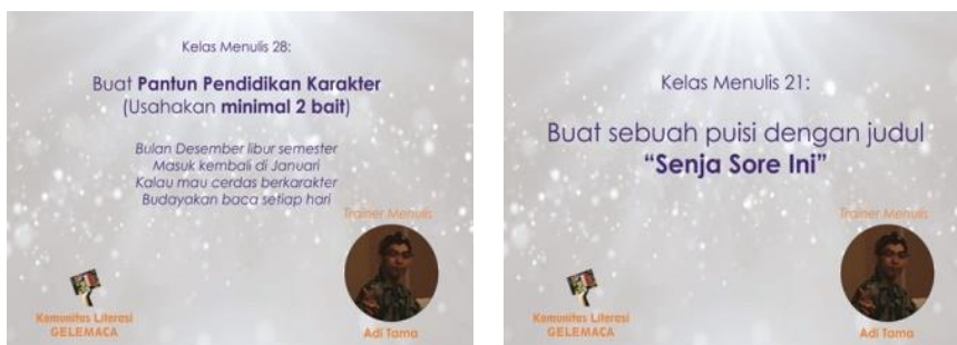
Gambar 3-4. Contoh materi menulis Puisi dan Pantun

Minggu pertama kelas menulis dimulai dengan materi mudah, peserta guru penulis hanya diminta membuat 1-2 paragraf tulisan sesuai tema. Selanjutnya para guru yang menjadi peserta dalam grup penulis semakin semangat dalam berlatih menulis. Mereka terlihat senang ketika tulisannya mendapat nilai, support , motivasi dan apresiasi dari guru pembimbing maupun teman guru lainnya. Ini menjadi sebuah energi positif yang kemudian menjadikan grup hidup dan terus diminati. Terbukti kenaikan jumlah peserta terlihat sangat signifikan. Peserta yang mengikuti workshop berjumlah 120 orang, setelah satu minggu berjalan grup ini bertambah hingga 180 orang lebih.