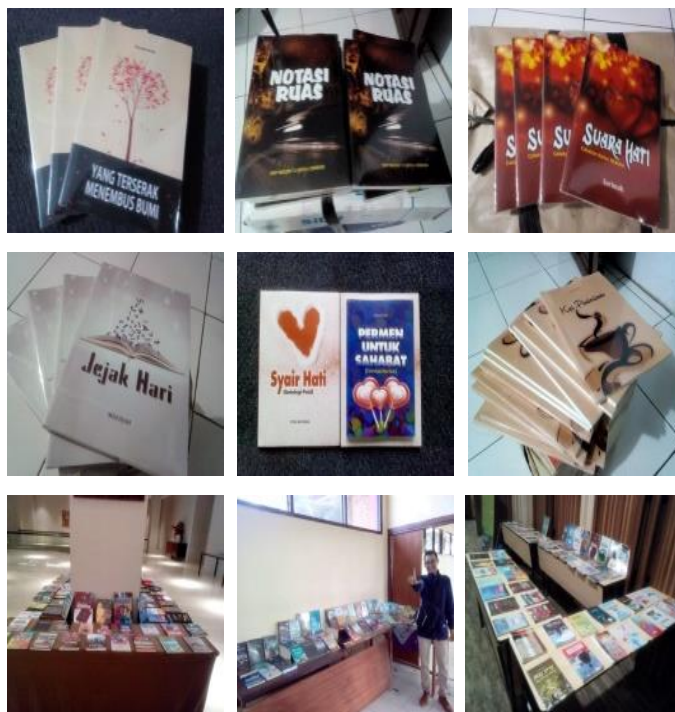
Gambar 7. Buku hasil karya (kepala sekolah, guru, siswa) se-Kota Cirebon

daring sangat memuaskan di mana 150 orang peserta aktif memberikan komentar atau apresiasi terhadap peserta lain yang mengirimkan tulisannya setiap malam. Peserta yang selalu hadir dalam kelas menulis setiap hari sekitar 60 orang, sedangkan 40 orang hadir pada saat materi tertentu saja. misalnya peserta yang suka menulis puisi hanya hadir saat materi menulis puisi, peserta yang suka menulis cerpen, hadir saat kelas menulis cerpen. Sisanya sekitar 50 orang hanya hadir kadang-kadang. Peserta ini umumnya peserta baru atau yang masih malu untuk mengirimkan tulisannya. Terakhir peserta yang hanya menyimak atau tidak aktif berjumlah 30 orang. Peserta ini kebanyakan dari kepala sekolah yang hanya memantau dan memberikan semangat pada gurunya yang berada dalam kelas menulis daring. Walaupun tidak aktif menulis banyak dari peserta ini juga termotivasi untuk menghasilkan karya. Biasanya antologi siswa baik itu puisi atau cerpen di sekolahnya masing-masing.