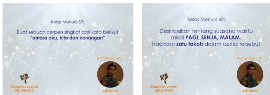
Gambar 5-6. Contoh materi menulis Cerita atau Cerpren sederhana

Memasuki bulan kedua materi yang diberikan mengharuskan peserta membuat tulisan lebih banyak, lebih panjang dari sebelumnya. Fase ini peserta diminta membuat sebuah cerita pendek sederhana baik itu fiksi maupun cerita nyata dari kisah mereka.