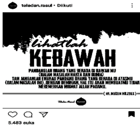
Gambar 3. Konten nirbaper akun teladan.rasul

Konten nirbaper di atas hanya mendapat kurang dari enam ribu like dan tidak lebih dari sepuluh komentar. Pun juga konten-konten di akun ini yang nirbaper tidak jauh berbeda, sedikit saja mendapatkan respons. Berbanding terbalik dengan konten baper yang bisa mendapat lima kali lipat respons melebihi konten nirbaper.