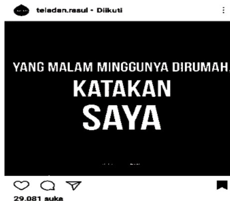
Gambar 4. Konten Baper akun teladan.rasul

Konten nirbaper di atas hanya mendapat kurang dari enam ribu like dan tidak lebih dari sepuluh komentar. Pun juga konten-konten di akun ini yang nirbaper tidak jauh berbeda, sedikit saja mendapatkan respons. Berbanding terbalik dengan konten baper yang bisa mendapat lima kali lipat respons melebihi konten nirbaper.