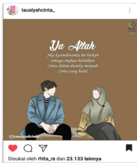
Gambar 1. Konten baper akun tausiyahcinta_

Gambar 1.1 adalah konten yang diunggah oleh akun tausiyahcinta_ pada 05 Juli 2018. Dalam empat hari konten ini telah mendapat dua puluh tiga ribu lebih like dan seratus delapan puluh komentar dari para pengguna Instagram. Konten ini menggambarkan dua sosok pemuda di mana sosok perempuan memaki kerudung sebagai simbol dari nilai Islam. Memakai kata pembuka, “Ya Allah,” yang menjurus sebagai pembuka dalam doa dan isi doa itu sendiri, “jika kesendirianku ini adalah hikmah semoga engkau kabulkan cinta dalam diamku menjadi cinta yang halal.” Doa tersebut setidaknya mengandung dua kata dan frasa inti yakni kesendirian dan cinta dalam diam. Kata kesendirian adalah bentuk nyata dari gambaran larangan berkhawat atau berduaan bagi lawan jenis di tempat sepi. Sementara frasa cinta dalam diam menggambarkan nalar pemuda kasmaran. Konten ini dapat menggabungkan antara gejala alami pemuda yakni ketertarikan kepada lawan jenis dengan apa yang mereka andaikan dengan nilai Islami. Setidaknya konten ini menjadi menarik bagi para pemuda yang tengah berada dalam kesendirian; sedang kagum dengan lawan jenis namun tidak sanggup mengungkapkan; dan ingin mendalami Islam.