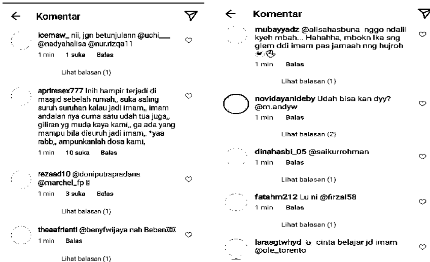
Gambar 5. Konten akun haditsku

Gambar 2.1 adalah konten unggahan akun haditsku yang mendapat dua puluh dua ribu like lebih dan lebih dari dua ratus komentar. Konten ini menyebutkan hadis yang diunggah adalah riwayat yang dikeluarkan oleh Ahmad dengan nomor indeks 25887. Tidak disebut keterangan penerbit, tahun cetak, dan segala keterangan lain agar pembaca pada umumnya bisa melacak sumber mana yang dirujuk oleh akun ini. Telaah lebih lanjut menunjukkan jika hadis di atas benar dikeluarkan oleh Ahmad dalam Musnad -nya. Hadis ini tercantum dalam bab hadis yang diriwayatkan oleh Salamah binti al-Hur, salah satu sahabatiyah yang kurang populer. Ahmad hanya mencantumkan dua hadis yang bersinggungan dengan sahabatiyah ini, dengan matan senada. Secara berurutan hadis dari Salamah memiliki nomor indeks 27137 dan 27138. 14 Berbeda dengan nomor indeks yang disebut oleh akun haditsku. Selisih perbedaan nomor hadis terhitung mencolok di angka 1257. Dalam pelacakan lebih lanjut nomor indeks yang digunakan oleh akun haditsku sama dengan nomor hadis dalam aplikasi hadis keluaran Lidwa Pusaka. Sementara dalam ranah akademik referensi hadis dari aplikasi digital dianggap tidak lebih valid dari referensi kitab atau buku