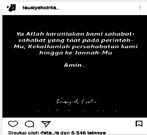
Gambar 2. Konten nirbaper tausiyahcinta_

Dari 1.6 juta pengikut akun tausiyahcinta_ kurang dari 3% yang memberikan respons berupa like dan hanya sepersepuluh dari 1% yang memberikan komentar pada konten tersebut. Meskipun secara prosentase terhitung sedikit yang memberikan respons catatan ini lebih baik dibanding konten nir-baper.