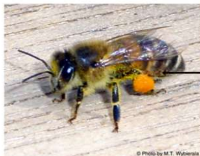
Pollen load pada pollen basket

Educational Pictures about Honey Bees University of Minnesota Instructional Poster #159 - Gary S. Reuter, Department of Entomology WWW.EXTENSION.UMN.EDU/HONEYBEES 2 of 15