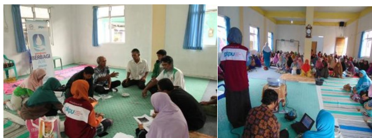
Gambar 4 Rembug dan Edukasi Warga

Selain gotong royong instalasi pipa yang terlihat pada Gambar 3, partisipasi aktif masyarakat dalam Program Berbagi Air Bersih ini juga terlihat pada kegiatan lainnya seperti keikutsertaan pada kegiatan assessment , rembug warga, implementasi, edukasi, dan lainnya yang secara rinci dapat dilihat pada Tabel 3. Tabel 3 menunjukkan peran aktif masyarakat dalam proses pembangunan sumberdaya fisik maupun sumberdaya manusia demi tercapainya tujuan bersama yaitu meningkatkan kualitas hidup bersama. Dapat dilihat juga pada Tabel 3 proses perjalanan waktu yang sudah ditentukan dalam pencapaian program serta jumlah partisipasi masyarakat di setiap kegiatan yang telah direncanakan bersama.