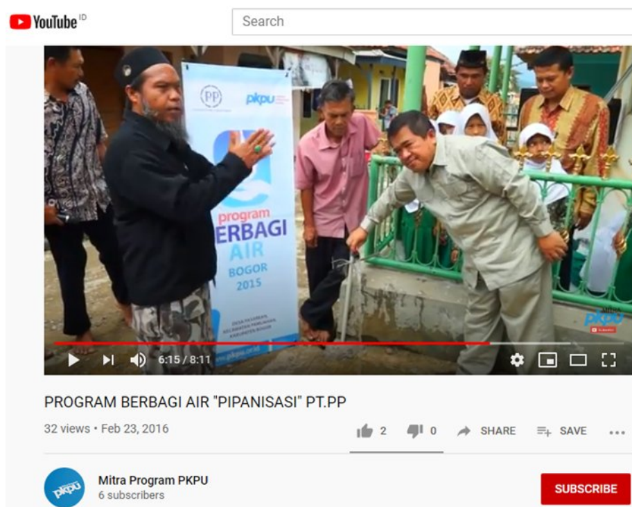
Gambar 5 Screen Shot Program Berbagi Air (Pipanisasi) PKPU - PT. PP

Media online yang digunakan untuk menyampaikan pesan pembangunan yaitu melalui channel YouTube yang dimiliki oleh PKPU. Pada channel YouTube ini hanya video dokumenter program berbagi air PKPU-PT PP yang ditayangkan. Tujuan dari penayangan video dokumenter proses pembangunan sarana air bersih ini, selain untuk media promosi pihak terkait, yaitu untuk menyampaikan pesan pembangunan di bidang kesehatan (sanitasi) yang terjadi di Desa Pasarean Kab. Bogor, agar masyarakat memperoleh informasi terkait pemecahan masalah sosial ini melalui program berbagi air yang dilaksanakan oleh PKPU-PT. PP. Video dokumenter ini ditayangkan pada tanggal 23 Februari 2016 dengan nama akun Mitra Program PKPU dan dapat diakses pada link youtube: https://www.youtube.com/watch?v=mr3zGrgP67c . Video dokumenter yang memiliki durasi 8 menit 11 detik ini telah ditonton 32 kali, namun hanya sedikit mendapat like (2) dan subscribe (6). Berikut Gambar Screen shot dari channel youtube akun Mitra Program PKPU Program Berbagi Air (Pipanisasi) PKPU - PT. PP dapat dilihat pada Gambar 5.