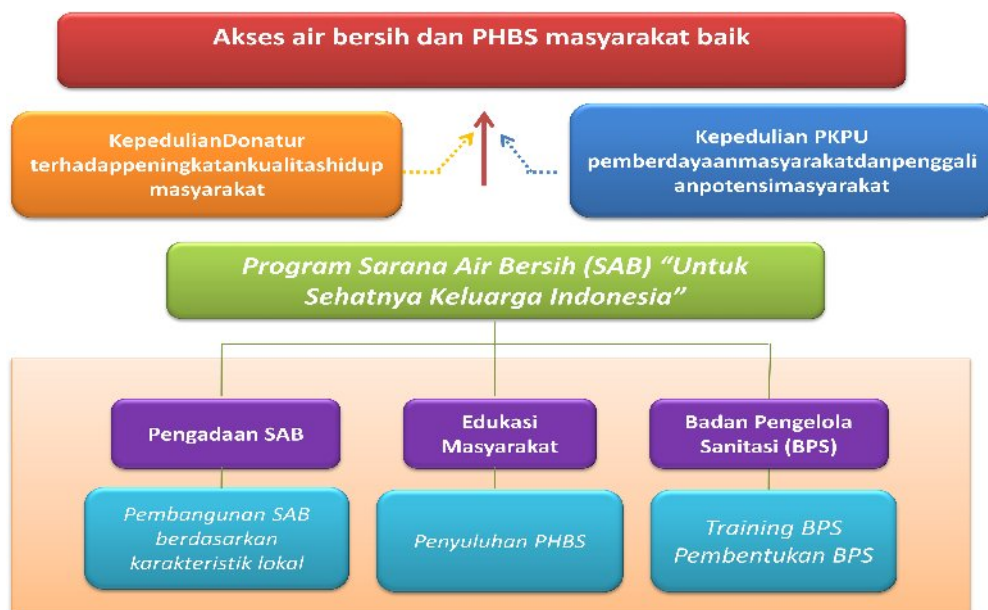
Gambar 2 Skema Program Berbagi Air di Desa Pasarean

Berdasarkan skema pada Gambar 2, program berbagi air di Desa Pasarean memiliki tujuan dan hasil harapan bersama, yaitu diharapkan dapat menciptakan derajat kesehatan masyarakat melalui penyediaan sarana sanitasi dan edukasi masyarakat, mempermudah akses masyarakat untuk mendapatkan air bersih bagi kehidupan sehari-hari, serta meningkatkan pengetahuan masyarakat terkait pola hidup bersih dan sehat (PHBS).