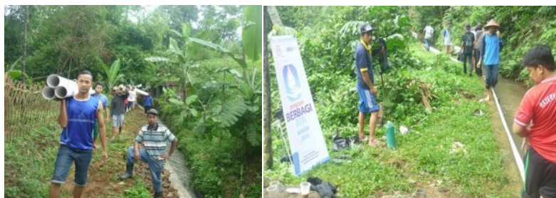
Gambar 3 Gotong Royong Instalasi Pipa

Sebelum menganalisis dan mengetahui tingkat partisipasi masyarakat, terlebih dahulu peneliti akan memaparkan keragaman bentuk partisipasi masyarakat pada Program Berbagi Air di Desa Pasarean. Berdasarkan pengamatan peneliti didapat bahwa ragam bentuk partisipasi masyarakat pada Program Berbagi Air yaitu masyarakat masuk dalam bentuk partisipasi kedua yaitu masyarakat desa pasarean khususnya RW 01 terlibat dalam proses pembangunan sarana air baik pada tahap perencanaan, implementasi, hingga monitoring-evaluasi. Warga RW 01 Desa Pasarean pun tidak memperoleh imbalan atas korbanan input yang diberikan, tetapi semua warga RW 01 dapat menikmati hasil pembangunan sarana air bersih diupayakan bersama-sama baik dari pihak internal masyarakat RW 01 maupun pihak eksternal seperti PKPU dan PT Pembangunan Perumahan sebagai supporter . Keragaman bentuk partisipasi dapat tergambarkan oleh beberapa dokumentasi kegiatan masyarakat pada program berbagi air bersih dalam Gambar 3 dan Gambar 4.