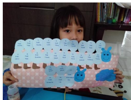
Sabia dari pengajar kak putri Surabaya

Berkaitan dengan metode atau sistem pembelajaran Al-Qur'an dari lembaga Ka Uqoy Private ini, peneliti melakukan wawancara secara online karena masih dalam keadaan musim pandemi dan psbb di daerah jawa dan bali yang tidak memungkinkan untuk bertemu dengan tatap muka, maka wawancara di lakukan dengan bantuan aplikasi yang mana menghubungkan langsung pada salah satu pengajar dari koordinasi dari lembaga Ka Uqoy Private dari cabang kota metropolitan kedua yaitu Surabaya. Mengatakan kalau lembaga Ka Uqoy Private ini untuk metode pembelajaran Al-Qur'annya menggunakan metode Fun Learning . Yaitu pada pengajar di tuntun untuk menyiapkan bahan ajar yang menyenangkan ketika sebelum terjadinya belajar mengajar, dan harus sesuai dengan silabus yang sudah di bserikan sama lembaga Ka Uqoy Private. Bahan ajar ini maksudnya ialah sebuah alat peraga yang bagi anak-anak usia dini itu sangat menarik seperti dalam contoh berikut.