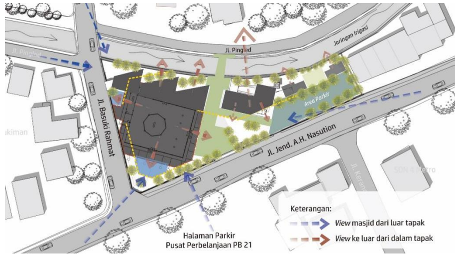
Gambar 3. Konsep Pengembangan Bentuk dan View Masjid Jami' Al Mujahidien Yosodadi Tahun 2020.