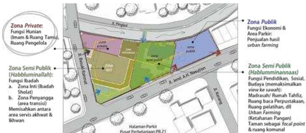
Gambar 4. Konsep Pengembangan Zonasi Masjid Jami' Al Mujahidien Yosodadi Tahun 2020.

Aktivitas utama/inti Masjid Jami' Al Mujahidien Yosodadi adalah ibadah, di mana aktivitas ini termasuk dalam zona semi publik ( hablumminallah ), ditunjukkan pada Gambar 4. Aktivitas pengguna bangunan erat kaitannya dengan pola sirkulasi yang akan dibentuk dan beradaptasi dengan kebiasaan baru pengguna bangunan di tengah Pandemi Covid-19 sesuai dengan standar Kemenkes dan WHO. Sirkulasi dimulai dari pintu masuk utama ( main entrance ), setiap pengguna baik jamaah ataupun non jamaah yang akan masuk masjid harus mencuci tangan terlebih dahulu dengan menggunakan sabun higienis. Saat ini Masjid Al Mujahidien Yosodadi masih menggunakan material sederhana non permanen sebagai tata penanda ( signage ) untuk physical distancing dan sosial distancing . Salah satu pertimbangan yaitu faktor kenyamanan dan memasukkan penghawaan alami ke dalam bangunan utama yang perlu ditingkatkan melalui penambahan ruang selasar sebagai ruang transisi sekaligus peredam udara panas dari luar dengan menggunakan bidang horizontal yang berpori seperti roaster dan/atau elemen air sebagai unsur penyejuk ke dalam ruangan utama.