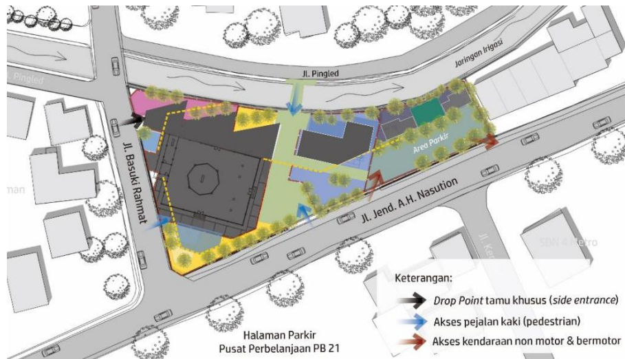
Gambar 5. Hasil Analisis Tapak: Konsep Pengembangan I Sirkulasi Masjid Jami' Al Mujahidien Yosodadi