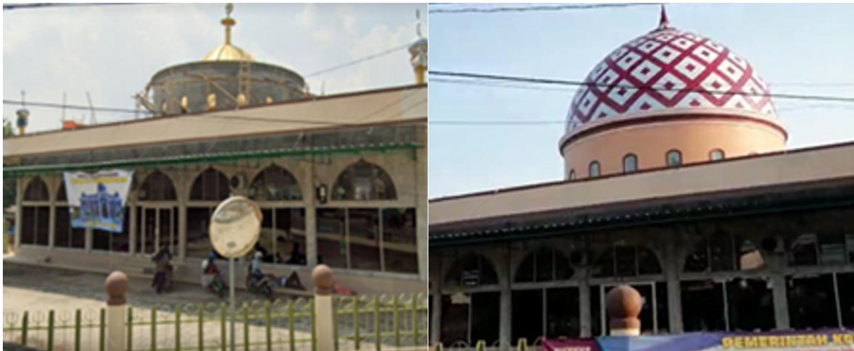
Gambar 2. Renovasi Kubah Masjid Jami' Al Mujahidien Yosodadi pada Tahun 2019

perencanaan dan pembangunan fisik Masjid. Kegiatan pengembangan konsep Masjid Al Mujahidien Yosodadi ini merupakan lanjutan dari kegiatan bantuan teknis gambar eksisting bangunan sebelumnya yang dilakukan pada tahun 2018 (Gambar 1). Dalam kurun waktu antara tahun 2018 sampai dengan tahun 2019, panitia pembangunan melakukan pembongkaran dua bangunan yaitu bangunan bekas Madrasah (B) dan bangunan toilet dan tempat wudhu (E), dan mengubah posisi bangunan toilet dan tempat wudhu ke bagian timur bangunan Perpustakaan (D). Sedangkan bangunan hunian Imam Masjid (C) masih dipertahankan hingga saat ini. Berdasarkan pertimbangan memperindah bangunan masjid, pada medio tahun 2019 panitia pembangunan melakukan penggantian kubah Masjid dengan bahan enamel dengan perkuatan struktur pada kubah itu sendiri yang mengakibatkan terjadi penurunan kolom sekitar 2 cm setelah beberapa minggu pemasangan, sehingga panitia pembangunan kemudian melakukan pembongkaran kubah lama untuk mengurangi beban atap (Gambar 2).