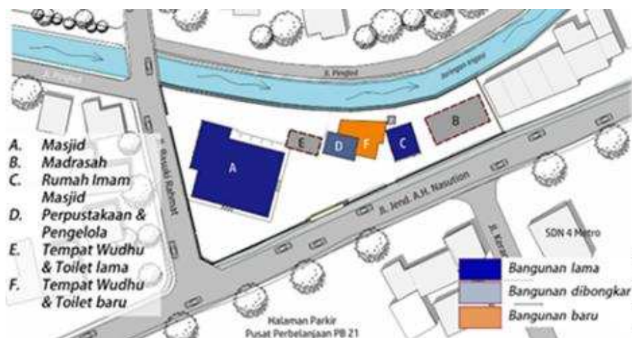
Gambar 1. Perubahan tata bangunan kompleks Masjid Jami' Al Mujahidien Tahun 2020

Pada tahun 1990-an, Masjid Jami' Al Mujahidien Yosodadi Kota Metro Provinsi Lampung dikenal menjadi pusat informasi dan kegiatan Islami di lingkungan Kelurahan Yosodadi, seperti kegiatan pengajian Badan Kontak Majelis Taklim (BKMT), konsultasi keluarga, perkumpulan remaja masjid, Taman Pendidikan Alqur'an (TPA) yang menempati bangunan madrasah, pelatihan-pelatihan menjadi khotib, muazin , dan bilal (Kesuma & Persada, 2019). Masjid Jami' Al Mujahidien Yosodadi merupakan masjid jami' dengan status sebagai masjid kelurahan. Masjid yang berdiri sejak tahun 1976 ini, saat ini mengalami degradasi fungsi masjid, terutama kegiatan pendidikan Islami seperti pesantren kilat saat ini menempati ruang ibadah utama (di dalam Masjid), dikarenakan bangunan lama yang sudah tidak layak yang kemudian dilakukan demolish (pembongkaran) bangunan pada tahun 2019. Selain itu, lingkungan di sekitar masjid yang mengalami perkembangan komersialisasi cukup pesat, menjadikan ruang-ruang terbuka masjid dimanfaatkan sebagai area parkir tambahan dan dapat menyebabkan fungsi utama masjid sebagai tempat ibadah menjadi kurang maksimal.