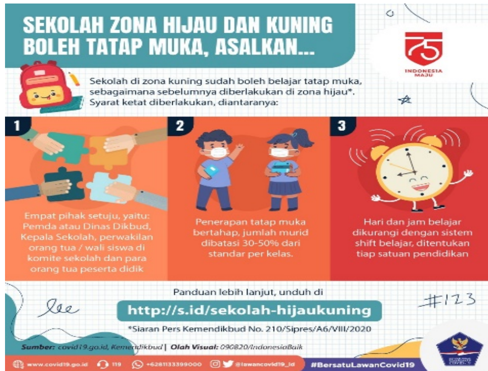
Gambar 2. Flyer dari Kemendikbud mengenai zonasi sekolah selama pandemi Covid-19

bervariasi berupa diskusi, flyer , dan menonton video. Guru-guru yang hadir dalam kegiatan PkM ini sebanyak 15 orang yang berasal dari dua jurusan yaitu Farmasi dan Otomotif.