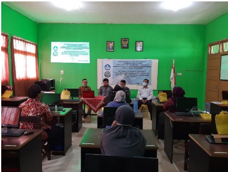
Gambar 1. Sosialisasi di SMK Terpadu Citra Bangsa Kota Tarakan

Dalam tahap perencanaan, pemilihan lokasi PKM menjadi prioritas utama dalam kegiatan ini. Tempat belajar mengajar seperti sekolah merupakan salah satu lokasi yang menjadi titik rawan penyebaran Covid-19 dikarenakan konsentrasi masyarakat berkumpul antara guru dan murid menjadi faktor utamanya. SMK Terpadu Citra Bangsa merupakan salah satu sekolah swasta di Kota Tarakan yang melaksanakan program LFH ( learning from home ) sehingga seluruh kegiatan belajar mengajar dilakukan secara daring (dalam jaringan), namun para guru SMK Citra Bangsa tetap melakukan proses mengajar dari sekolah, sehingga hal ini tentu membuat resiko penyebaran Covid-19 tetap tinggi. Oleh karena itu, pelatihan ini menekankan perlunya pengarahannya protokol kesehatan yang baik di lingkungan sekolah bagi seluruh guru dan tenaga kependidikan.