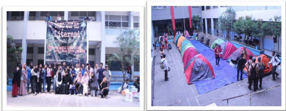
Gambar 1. Aktivitas Camp Quran di SMK Nasional Makassar