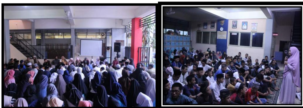
Gambar 2. Aktivitas Siswa pada Program Camp Quran

Hasil wawancara tersebut membuktikan bahwa minat siswa mengikuti program camp Quran menunjukkan adanya peningkatan. Hal ini disebabkan adanya dorongan baik dari aturan sekolah yang berhasil menerapkan kedisiplinan, selain itu juga komitmen dan konsistensi pengelola kegiatan Program Camp Quran dalam mendesain kegiatan ini menjadi menyenangkan dan dapat memicu kesadaran peserta didik betapa pentingnya kegiatan tersebut dalam meningkatkan wawasan keagamaan dan memiliki akhlak yang mulia.