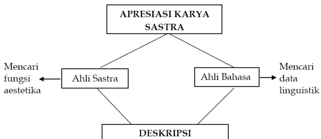
Gambar 1. Dua sudut pandang analisis karya sastra

Salah satu aplikasi LSF adalah untuk mengetahui teks-teks sastra dan sifat-sifatnya (Halliday, 1994: xxix). Berkaitan dengan kajian teks, stilistika merupakan cabang linguistik yang tidak hanya digunakan untuk menganalisis teks-teks yang faktual ( non-literary texts ), tetapi juga dapat digunakan untuk menganalisis teks sastra ( literary texts ) (Leech, 1985). Pertanyaan yang sering muncul bagi seorang linguist adalah mengapa seorang penulis (termasuk penulis karya sastra) memilih satuan-satuan leksikogramatika ( styles ) tertentu untuk mengekspresikan dirinya, sedangkan ahli kritik sastra ( literary critics ) mempertanyakan bagaimana dampak estetika dapat dicapai melalui bahasa (Widdowson, 1975: 3). Dua sudut pandang yang berbeda dalam mengkaji karya sastra disajikan pada Gambar 1 berikut.