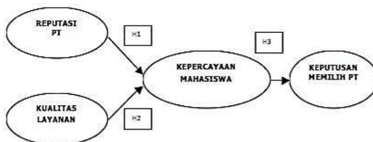
Gambar 1. Kerangka Konseptual

Berdasarkan kerangka konseptual tersebut, maka hipotesis yang diajukan dalam penelitian ini adalah: