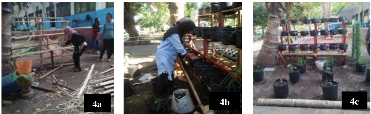
Gambar 4a, 4b dan 4c. Tahapan pembuatan vertikultur dari bambu

Setelah kegiatan penyuluhan dan pelatihan, dilakukan identifikasi respon kebermanfaatan kegiatan kepada peserta. Indikator keberhasilan kegiatan pelatihan dari sisi proses ini, juga tampak dari hasil evaluasi yang didasarkan pada taraf respon peserta mengenai kebermanfaatan kegiatan pelatihan yang diikuti, dengan empat kategori yakni sangat bermanfaat (85%), bermanfaat (15%), kurang bermanfaat (0) dan tidak bermanfaat (0). Respon ini menunjukkan