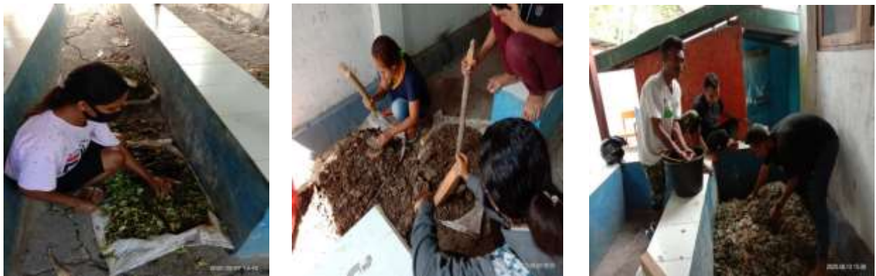
Gambar 2a, 2b dan 2c. Tahapan pembuatan pupuk kompos