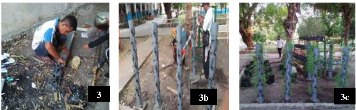
Gambar 3a, 3b dan 3c. Tahapan pembuatan vertikultur dari pipa paralon