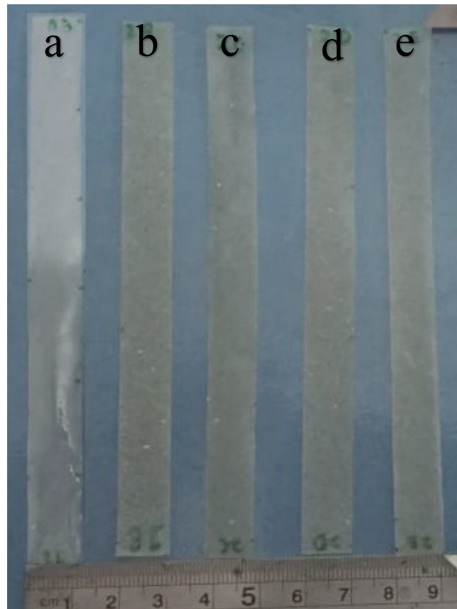
Gambar 1. Sampel dengan variasi konsentrasi serat a) 0%, b) 2%, c) 4%, d) 6% dan e) 8%.