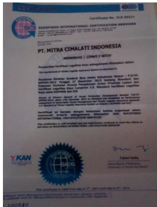
Gambar 4. Sertifikat Sistem Verifikasi Legalitas Kayu PT. Mitra Cimalati Indonesia

Penyandang Cacat di Perusahaan. Bentuk kepatuhan perusahaan terhadap Undang-undang Ketenagakerjaan juga dilakukan dengan menaati Peraturan Menteri Tenaga Kerja No. 05/Men/1989 tanggal 29 Mei 1989 tentang Upah Minimum dengan memberikan upah kepada karyawan di atas Upah Minimum Regional (UMR) yang berlaku di Kabupaten Cilacap Barat, yaitu Rp 816.000,00 setiap bulannya. Perusahaan juga menaati Undang-undang RI Nomor 36 Tahun 2008 tentang Pajak Penghasilan dengan membayarkan PPh 21, PPh 25, serta menaati Undang-undang RI Nomor 42 Tahun 2009 tentang Pajak Pertambahan Nilai dengan membayarkan PPN ekspor sebesar 0%. Bentuk kepatuhan perusahaan terhadap regulasi ekspor dibuktikan dengan adanya ijin ekspor dari Sucofindo dan Direktorat Ekspor Produk Pertanian dan Kehutanan sesuai dengan syarat ekspor dari Menteri Perdagangan, serta perusahaan telah terverifikasi dengan SVLK (Sistem Verifikasi Legalitas Kayu) sesuai dengan Peraturan Menteri Perdagangan Republik Indonesia Nomor 64/M-DAG/PER/10/2012 tentang Ketentuan Ekspor Produk Industri Kehutanan. Dan perusahaan juga memiliki Dokumen Upaya Pengelolaan Lingkungan – Upaya Pemantauan Lingkungan yang telah disetujui oleh Badan Lingkungan Hidup sesuai dengan Undang-undang Nomor 32 Tahun 2009 tentang Perlindungan dan Pengelolaan Lingkungan Hidup serta mematuhi Keputusan Menteri Negara Lingkungan Hidup Nomor 05 Tahun 2012 tentang Jenis Rencana Usaha dan/atau Kegiatan yang Wajib Memiliki AMDAL.