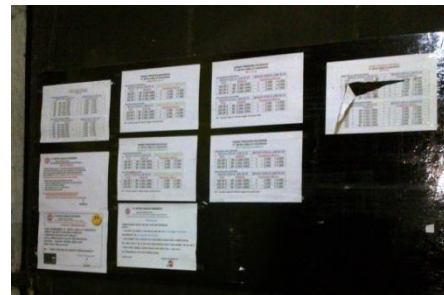
Gambar 2. Papan Pengumuman sebagai Media Penyampaian Informasi

informal yaitu lisan dari mulut ke mulut. Rapat menjadi kegiatan rutin yang diadakan setiap divisi sebagai sarana untuk berkomunikasi dua arah antara karyawan dengan atasan, dan juga sebagai media untuk mengetahui progress tentang divisi masing-masing. Alur dalam menyampaikan informasi umum dalam perusahaan tidak begitu dipertimbangkan, yang terpenting adalah keakuratan dari informasi tersebut dan setiap bagian dalam perusahaan dapat dapat mengakses dengan mudah. Jika suatu informasi lebih efektif disampaikan langsung kepada orang yang bersangkutan, maka informasi tidak harus melalui alur dari atasan ke bawahan atau sebaliknya.