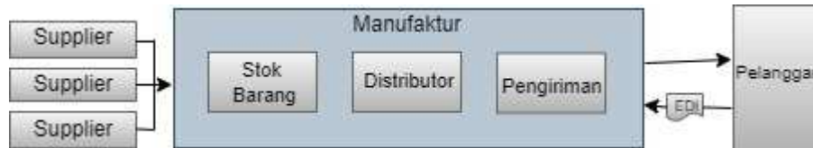
Gambar 1. Skema Prosedur Pesanan

untuk mendukung pengambilan keputusan perusahaan. Dengan demikian, arus informasi yang matang diperlukan untuk memungkinkan pembaruan informasi yang cepat, akurat dan dinamis untuk diproses secara real time. Selain itu, bahkan jika sistem ERP diimplementasikan dengan baik, karena pendekatan manajemen informasi tradisionalnya, itu masih bisa menjadi alat yang tidak secepat yang diinginkan untuk mendukung ekstraksi, transformasi, dan pemuatan untuk mengekstraksi data dari database [16]. Ini menyiratkan bahwa kemacetan informasi di perusahaan terus-menerus diharapkan, yang menghasilkan hambatan untuk membuat keputusan yang gesit. Karena fakta ini, alat berbasis ETL hanya akan bekerja di bawah periode beban kerja yang rendah. Akibatnya, pengguna tidak dapat mengakses informasi data real-time yang dimuat di database bisnis dan operasional, dan akibatnya ini akan menyatakan kurangnya keputusan karena ketersediaan dan visibilitas informasi [17].