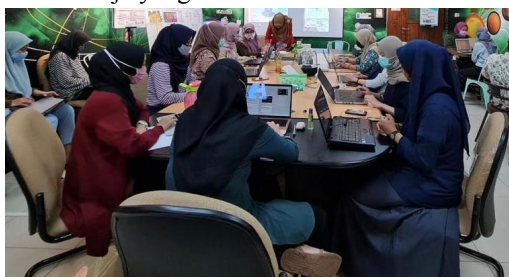
Gambar 3. Pendampingan Pelatihan

Pengelolaan program pelatihan kewirausahaan bersifat siklis, hasil penilaian program dan hasil belajar peserta pelatihan digunakan sebagai dasar penyusunan rencana pengembangan program. Kegiatan pembinaan peserta diklat praktik merintis wirausaha mandiri dilakukan dalam bentuk pendampingan. Pendampingan peningkatan kualitas produk, bentuk kemasan produk, teknik pemasaran produk secara online dan cara booking keuangan menggunakan aplikasi excel [16]. Hasil dari rencana yang disusun memberikan gambaran rinci tentang pekerjaan yang akan dilakukan dalam semua kegiatan pelatihan dan kebutuhan sumber daya untuk mewujudkan perencanaan program pelatihan kewirausahaan. Menyelenggarakan kegiatan dengan memberikan tugas kepada sumber daya yang tepat sesuai dengan kemampuannya, sehingga menghasilkan kinerja yang maksimal.