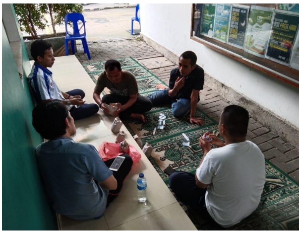
Gambar 2. Koordinator desa literasi

aktif peserta pelatihan dalam kegiatan pembelajaran. Mobilisasi dilakukan melalui upaya menumbuhkan dan mengembangkan kemampuan, semangat, kepercayaan dan partisipasi atau dengan menghargai nilai-nilai kemanusiaan yang membuatnya nyaman. Fasilitator menciptakan suasana belajar yang menyenangkan dan bermakna dengan komunikasi interaktif berdasarkan pola pengalaman belajar yang dimiliki siswa. Koordinator desa literasi sebagai pemimpin berperan penting dalam membangun hubungan kemanusiaan yang tinggi tidak hanya bagi fasilitator, tetapi juga bagi siswa. Pemimpin mengarahkan dan mengontrol keaktifan proses pelatihan, sehingga mempengaruhi kinerja fasilitator dalam mengajarkan keterampilan manajemen kewirausahaan. Materi pelatihan kewirausahaan disampaikan untuk mencapai kompetensi dalam merencanakan kewirausahaan, melaksanakan kewirausahaan dan mengembangkan kewirausahaan, mengembangkan jiwa kewirausahaan (kerjasama, persaingan sehat, bekerja sesuai target, disiplin, mengambil keputusan, mengkomunikasikan ide atau pendapat, memimpin) [10] [11]. Pemimpin mengarahkan dan mengontrol keaktifan proses pelatihan, sehingga mempengaruhi kinerja fasilitator dalam mengajarkan keterampilan manajemen kewirausahaan [12].