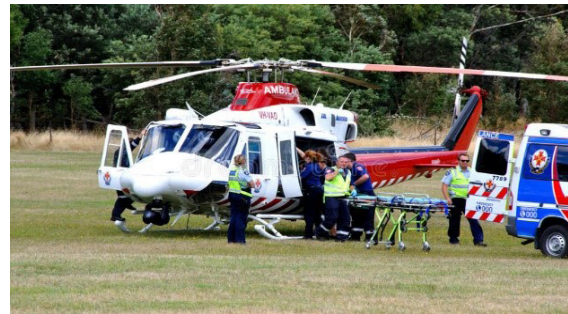
Gambar 2. Helikopter Bell-412 ambulans udara

Semua persyaratan ini dimiliki oleh helikopter jenis Bell-412 yang peneliti tetapkan sebagai heli yang bisa dipasang peralatan Medevac.