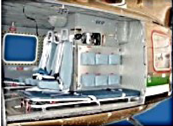
Gambar 5. Transport Capability 2 Patient