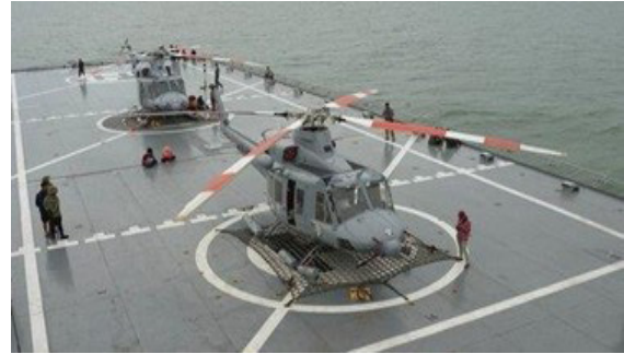
Gambar 1. Helikopter Bell-412 TNI Angkatan Laut landing di KRI LPD dr. Soeharso 990 class. 2020

Berdasarkan analisis dan temuan peneliti, maka diperoleh bahwa ada dua kebutuhan utama yaitu pengadaan dua helikopter serbaguna dan medevac kits portable . Hal ini juga sesuai kajian helikopter puserbal Surabaya tahun 2018 dimana peneliti menemukan bahwa Helikopter TNI Angkatan Laut yang memungkinkan dipasang peralatan medevac portable adalah berjenis Bell-412.