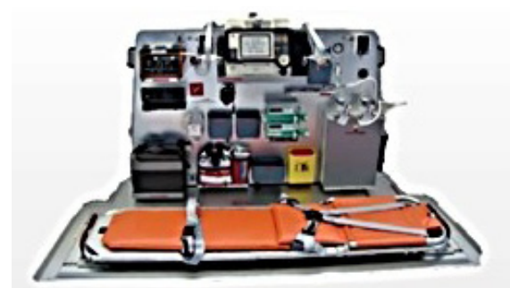
Gambar 4. Transport Capability 1 Patient