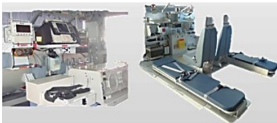
Gambar 6. Transport Capability 2 Patient