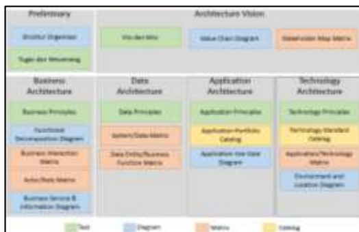
Gambar 3. Enterprise Architecture View Point

digunakan untuk memberikan gambaran penerapan solusi bisnis di PT. XYZ.