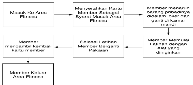
Gambar 4. SOP Dari Member Yang Menggunakan Pelayanan Dari Artharaga Fitness Center

Standard operasional member dapat dilihat dari gambar flowchart berikut ini :