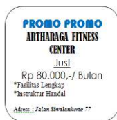
Gambar 2. Bentuk Selebaran Atau Brosur Artharaga fitness center

Cara Artharaga fitness center untuk mengikuti event-event termasuk kedalam Public Relation karena Artharaga fitness center berusaha untuk dekat dengan masyarakat dengan mengikuti perlombaan tersebut Cara lain yang digunakan adalah Budiman Muliono dengan cara menyebarkan selebaran, selebaran atau brosur dibagikan ke kampus-kampus seperti halnya kampus UK.Petra, UPN, Untag45 dan Unesa, selebaran juga dibagikan juga ke rumah-rumah disekitar Artharaga fitness center , selebaran disebarakan setiap Artharaga fitness center mengadakan promosi. Bentuk selebaran seperti pada gambar berikut ini :