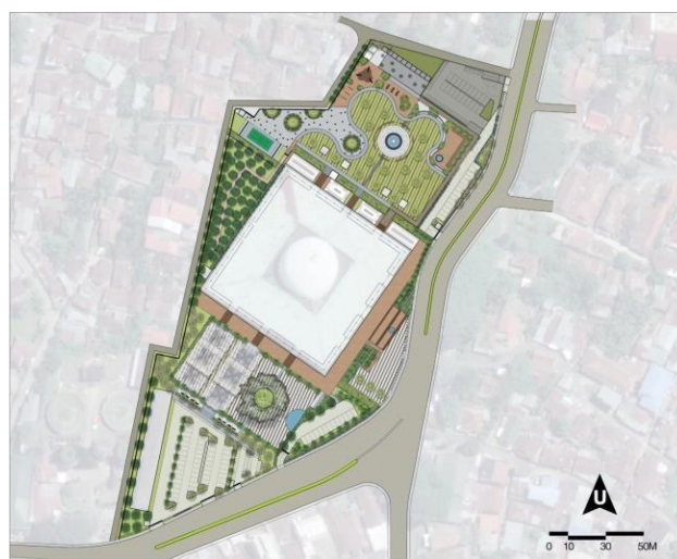
Gambar 1. Tapak Rencana Masjid Agung Al-Falah

Dalam desain perlu dipahami lingkup pemrograman dan kedudukan pemrograman itu di dalam desain, sebelum masuk kedalam pemrograman, maka perlu diketahui pengertian ataupun pendapat beberapa pakar tentang pemrograman, diantaranya pemrograman merupakan bagian penting dari proses desain atau posisi pemrograman merupakan awal kegiatan atau system dari suatu proses perancangan arsitektur ( W.Moleski dan H.Sanof ). Selanjutnya juga Pemrograman adalah bagian desain, karena pemrograman merupakan kegiatan analisis dalam kaitan upaya pemecahan masalah desain ( Mc.Laughlin ). Pemrograman merupakan bagian awal dari perancangan (Planning) dan produknya merupakan "informasi" sebagai input bagi kajian perkembangan masa yang akan datang. Disamping itu pemrograman selalu di alamatkan pada fakta-fakta, kondisi dan keputusan-keputusan (E.Agostini & E.T.White).