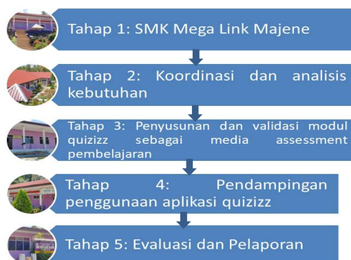
Gambar 3. Tahapan Kegiatan

Metode pelaksanaan pengabdian terdiri dari 5 tahap, ditunjukkan pada gambar 3 berikut.