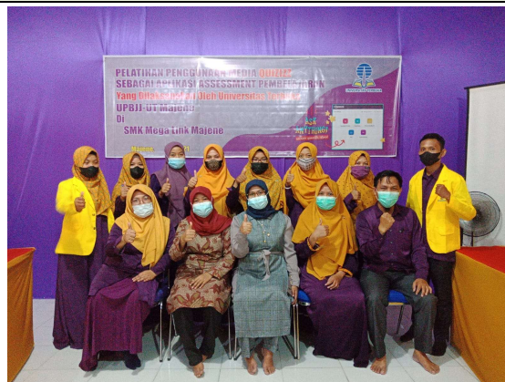
Gambar 1. Guru SMK Mega Link Majene

Kata kunci: quizizz, aplikasi, assessment, guru